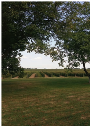
Slika 2. Pogled na fruškogorske vinograde