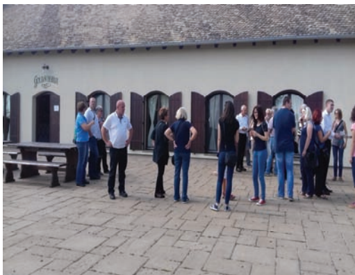
Slika 1. Pred vinogradarskom kućom Goldschmidt

Vučedol jedan je od najvažnijih arheoloških lokaliteta u Europi i eponimni lokalitet kulturne pojave koja je u vrijeme eneolitika, u trećem tisućljeću prije Krista, zauzimala područje današnjih dvanaest europskih zemalja. Nedavno otvoreni muzej oduševio nas je svojom kombinacijom položaja, arhitekture, ugodne atmosfere te ponajviše povijesne vrijednosti prikazane na vrlo suvremeni način. Tijekom obilaska muzeja uz stručno vodstvo upoznali smo