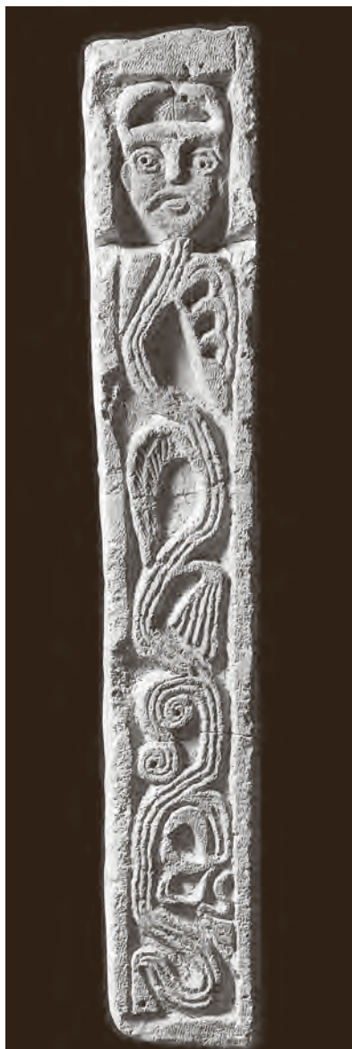
↑ Ulomak dovratnika iz crkve sv. Mihovila u Banjolama

U svakom slučaju, knjiga Ivana Matejčića i Sunčice Mustać djelo je koje svjedoči o dva kontinuiteta. Na jednoj strani o osebujnom, isprekidanom i skokovitom kontinuitetu života spomenika i njihove skulpturalne dekoracije i opreme, s vrhuncima u justinijanskom razdoblju i razdoblju karolinške vrhovne vlasti, koji završava postupnim usponom od razdoblja rane romanike, a na drugoj strani o kontinuitetu upoznavanja, vrednovanja i znanstvenog istraživanja korpusa starijeg istarskog kiparstva. Knjiga Kiparstvo od 4. do 13. stoljeća uistinu je pokazatelj kvalitete i dosega starijih povijesnoumjetničkih istraživanja, ali i napretka ostvarenog u posljednjih nekoliko desetljeća. Posrijedi je sinteza napora cijele generacije stručnjaka,