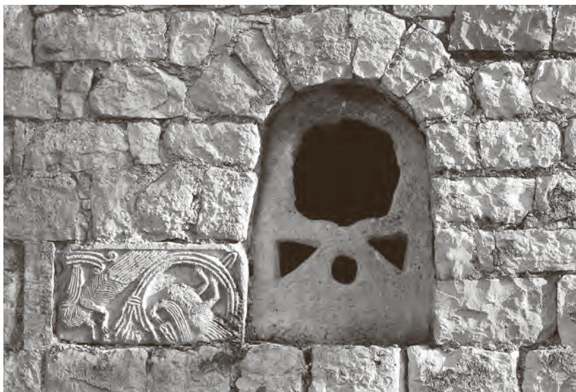
← Prozor s tranzenom i ulomkom pilastra oltarne ograde na crkvi sv. Lovre u Svetom Lovreču Pazenatičkom

u bazilici i episkopiju Eufrazijane te kapeli Sv. Marije Formoze u Puli) te romaničke drvene skulpture raspetog Krista (iz Gračišća, Bala, Motovuna i Galižane).