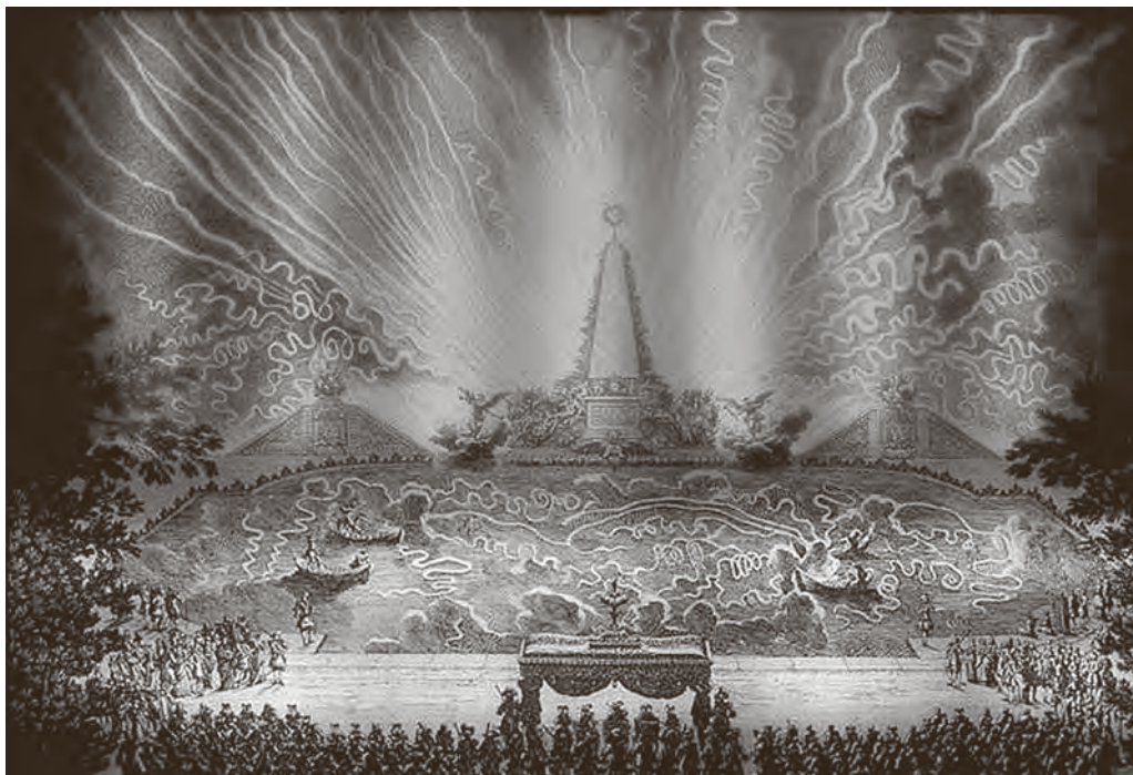
© S postava izložbe (FOTO: MUO–V. Benović, S. Budek)

Izložba Arhitektura i performans: grafike iz Kabineta Luja XIV. u fundusu MUO, Muzej za umjetnost i obrt 2. listopada 2015.–3. siječnja 2016. AUTORICE IZLOŽBE Anđelka Galić i Dubravka Botica