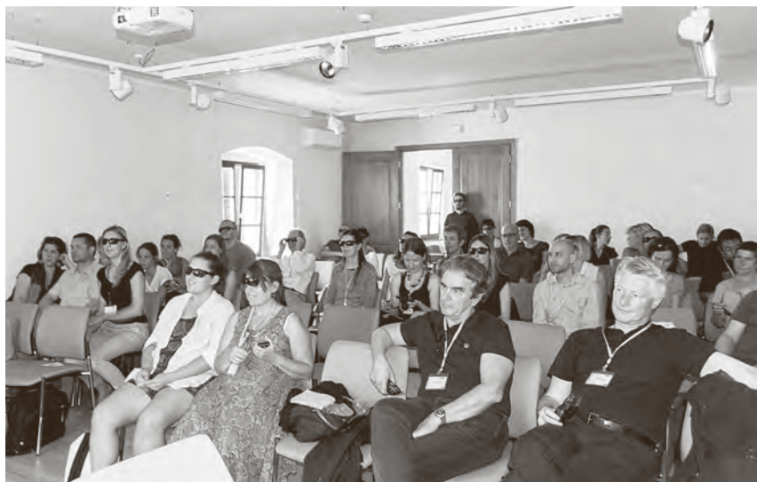
← Sa skupa Suvremena iskustva u restauriranju zidnih slika, Draguč

u žbukama kojeg uzrokuju eruptivne čestice soli prisutne u materijalima što dovodi do nepovratnih gubitka izvornog sloja boje. Umanjivanje i kontrolu sličnih degenerativnih procesa izložio je Laue. On je prikazao njemačke rezultate kombiniranja kontrole klimatskih uvjeta i mjerenja termodinamičkog ponašanja soli koji omogućuju bolji odabir prikladnih konzervatorsko-restauratorskih postupaka.