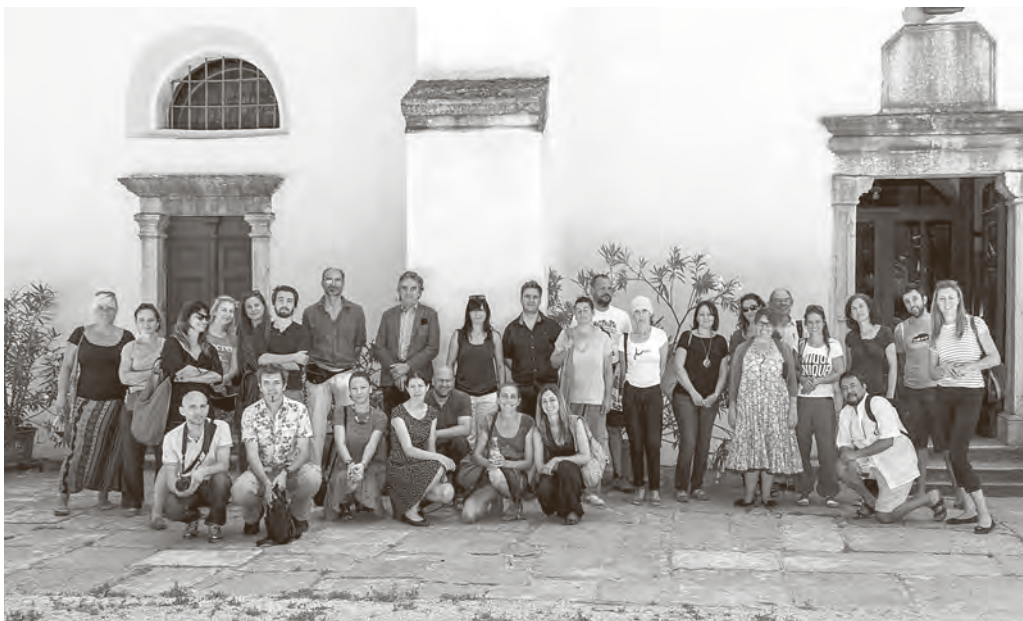
↑ Dio sudionika skupa ispred crkve sv. Nikole u Pazinu

Zapadne i Južne Europe, od Njemačke, Francuske, Velike Britanije, preko Portugala i Španjolske do susjednih nam Italije i Slovenije te same Hrvatske. Širokim rasponom tema prikazali su primjenu novih metoda dokumentiranja, analize materijala, specifična rješenja u restauraciji, metodološke probleme te korištenje novorazvijenih materijala.