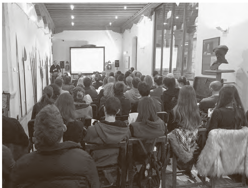
← Sa skupa, Muzej grada Splita