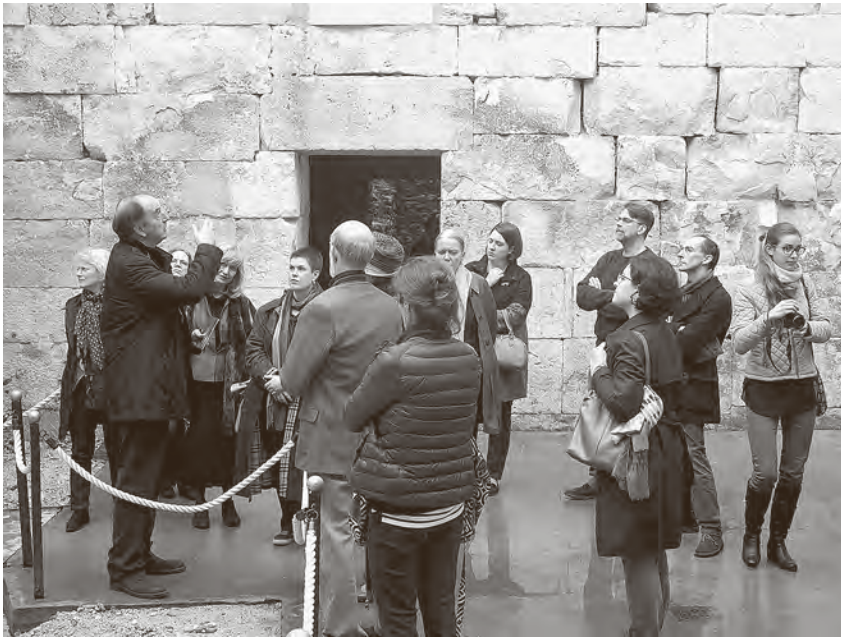
← Sa skupa, obilazak podruma Dioklecijanove palače

fokusirala se na detaljnu analizu grafičkih prikaza Željeznih vrata i Narodnoga trga u 18. stoljeću te vrednovala do koje mjere su ih trojica autora subjektivno donosili u svojim djelima. Ivan Mirnik i Ante Rendić-Miočević prikazali su kuriozitetno izdanje Adamove knjige o Dioklecijanovoj palači iz Livorna, pohranjeno u Arheološkom muzeju u Zagrebu. Pomnim čitanjem razlika u odnosu na londonsko izdanje otkriva se, osim povijesnih i arheoloških činjenica, i niz osobnih momenata autorā koji su sudjelovali u pripremi knjige, poput, primjerice, njihovih razmirica.