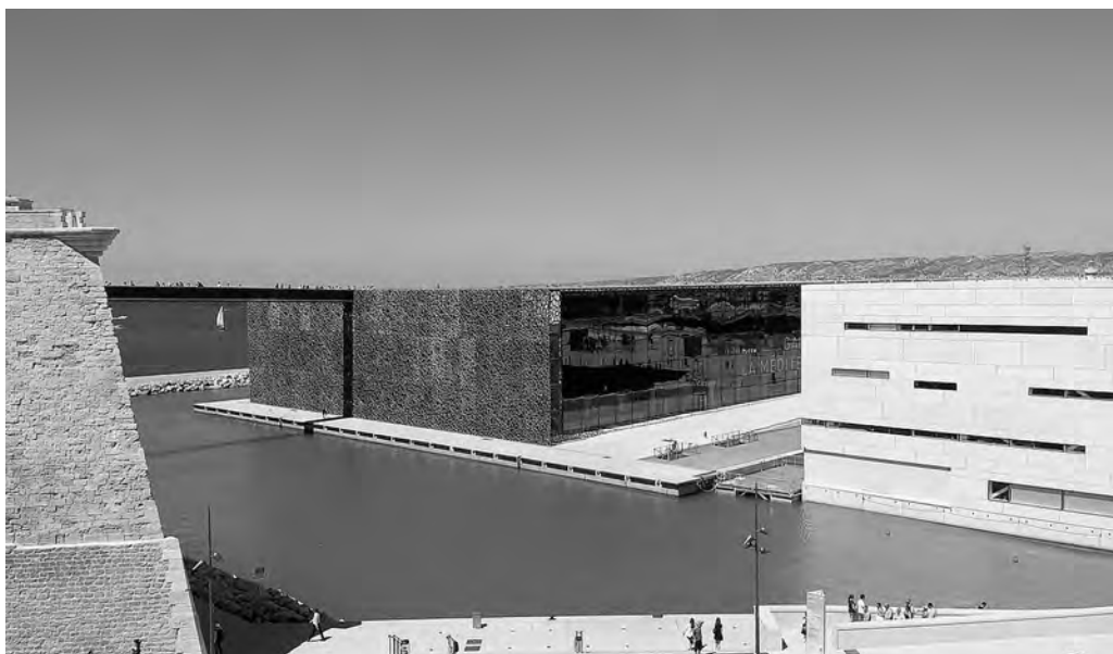
↑ Muzej europske i mediteranske civilizacije u Marseilleu