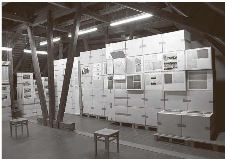
o Iz postava izložbe Industrijski centar države: zagrebačka industrijska baština 1918. – 1945., Muzej grada Zagreba. str. 57-61

Zagrebu te nuditi rješenja za njihovu kvalitetnu sadržajnu prenamjenu ( http://www.zg-ib.org/hr/projekt-info/ciljevi ). Navedeni ciljevi pokušavaju se ostvariti na nekoliko načina, prvenstveno ciklusom studijskih izložbi u razdoblju od 2010. do 2014. godine.