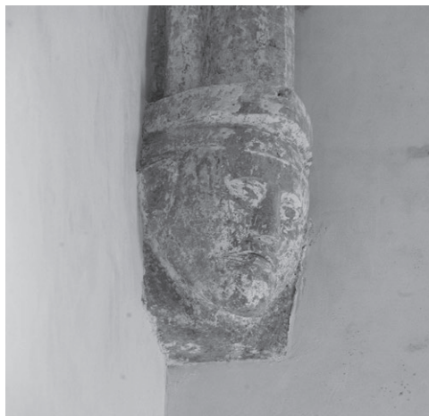
Slika 3: Konzola u svetištu crkve sv. Franje u Krku