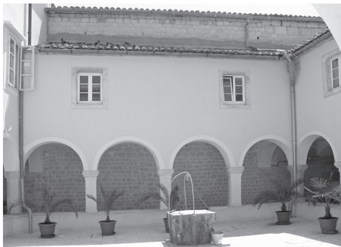
Slika 2: Sjeverni zid crkve sv. Franje u Krku

prema unutrašnjosti grada. Ovdje je na crkvenom zidu koji izviruje iznad krovišta klaustra jasno vidljiva i razlika gotičkoga sloga od onog izvedenog većim kvadrima, koji se pruža na produljenju zida prema zapadu. Okolnost da su se franjevci koristili zatečenim benediktinskim zdanjem slična je obližnjem, kasnijem primjeru na krčkom otočiću Košljunu, gdje su ostaci izvorne benediktinske trobrodne crkve konzervatorskim zahvatima u dvama navratima u posljednjih dvadesetak godina otkriveni, dokumentirani, a nedavno dobrim dijelom i prezentirani na sjevernom vanjskom licu zida crkve Navještenja Marijina. 13 Ta bi okolnost mogla ići u prilog nešto kasnijoj dataciji (prva polovina 14. stoljeća) jer su se franjevci u Krku najprije mogli koristiti zatečenim benediktinskim crkvenim zdanjem.