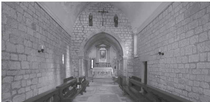
Slika 7: Unutrašnjost crkve sv. Frane na Komrčaru