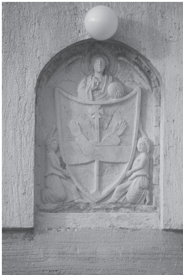
Slika 4: Franjevački grb nad ulazom u samostan sv. Franje u Krku