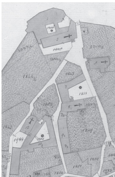
Slika. 1: Sjeverni dio grada Krka na katastarskoj mapi iz 1821. godine

Iako su samostan sv. Franje u gradu Krku trećoreci preuzeli tek 1783. godine 6 , zbog iznimne slojevitosti i starosti toga zdanja upravo njime započinjemo povijesno-umjetnički prikaz trećoredskih samostana na Kvarnerskim otocima. Na eliptičnom, u temeljima pretpovijesnom arealu pružanja krčkih gradskih zidina samostan zauzima njihov sami vršak pokraj sjevernih gradskih vrata Porte Sù(perior) . Iako smješten unutar zidina, ovaj je prostor u srednjem i ranom novom vijeku bio suburbanog karaktera. Podno njega, unutar krčkih gradskih zidina, od zapada prema istoku pružali su se i danas postojeći ženski benediktinski samostan Gospe od Anđela, ukinuti samostan klarisa s crkvom Marijina Navještenja i benediktinski samostan sv. Mihovila, od kojeg je preostala crkva koja danas nosi titular Gospe od Zdravlja. Odreda su se unutar zatvorenih samostanskih cjelina, kako je i uobičajeno uz samostanske zgrade i dvorišta, pružali prostrani vrtovi. Dok samostan sv. Franje zauzima područje uz sjeverne gradske zidine, dijelom se koristeći njima kao svojom sjevernom fasadom, crkva se pruža južno od njega. Pročeljem je orijentirana prema samostanskom vrtu, začeljem prema gradskim vratima, sjevernim zidom prema klausturu, a južnim prema Trgu krčkih glagoljaša, koji je u srednjem vijeku nosio logično ime sv. Mihovila, prema crkvi u koju se s njega moglo neposredno kročiti. 7