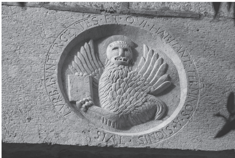
Slika 5: Reljef lava sv. Marka na nadvratniku portala produljenog dijela južnog zida crkve sv. Franje u Krku, snimio D. Krizmanić

Radovi su se zatim mogli nastaviti izvedbom robusnog zvonika oblikovanoga na način karakterističan za lokalne radionice u doba visoke renesanse na otoku Krku. Zvonik raščlanjen kamenim kordonskim vijencima ima jednostavne, danas dijelom zazidane monofore i bifore, ukrašene skromno izvedenom dekorativnom plastikom kapitela s palmetnim listovima i volutama te konzolama u obliku lavljih glavica. Dio toga materijala ondje je sekundarno dospio. Ponešto sličnosti oblikovanja otvora dijeli sa zvonikom omišaljske zborne crkve iz 1536. godine, iako je ondje riječ o još rustičnijoj realizaciji. Dekorativnoj plastici zvonika bliski su reljefi sakristijskog pila crkve sv. Franje, a na radove istih majstora nailazimo i na pročeljima krčkih gradskih kuća.