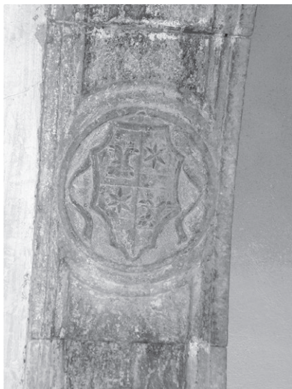
Slika 8: Grb obitelji Dominis na trijumfalnom luku crkve sv. Frane na Komrčaru

Tik pred svetištem, na mjestu rezerviranom za iznimno važna donatora, nalazi se grobna raka rapskoga slikara Juana Boschetusa iz 1515. godine. 40 Ploča je izvrstan i za rapske prilike vrlo složen primjer onoga što se naziva ornamentalnim repertoarom ugarske renesanse. Na sredini svake stranice vegetabilne bordure okvira ploče uklesan je pokojnikov monogram. Na središnjem je štitu, obrubljenom lovorovim vijencem, prikazana piramida, njezin odraz i sunce. Iz ljljlana nad štitom izviru nabrane vijoreće vrpce povijenih krajeva. Podno štita na plitkim vrpcama ovješena je tabula ansata s natpisom o pokojniku. 41 Odmah iza Bosche-