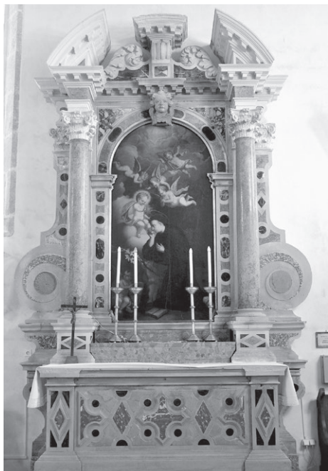
Slika 1: Giuseppe Cavallieri, oltar svetog Antuna Padovanskog, crkva svetog Franje, Krk, 1708.

I u Krku i u Kanfanaru identično su riješeni stipesi i njegove bočne konzole, retabl sa širokim bočnim volutama i atika s mesnatim lisnatim viticama. Korišten je isti mramor, žuti, crni i crveni, u kombinaciji s istarskim kamenom. Jedina je razlika da su u Kanfanaru kapiteli korintski, no jednako vješto klesani kao oni kompozitni u Krku, a umjesto krčkog kerubina, u Kanfanaru je u tjemenu luka pale isklesan grb obitelji Ruffini. Štoviše, na predeli, koja je većim djelom zaklonjena kasnijim mramornim tabernakulom, može se iščitati ime donatora, podestata Victora Ruffinija i 1707. godina. 12 S obzirom na kronologiju gradnje, može se smatrati da je oltar u Kanfanaru poslužio kao model za onaj u Krku. Naime, arhivski izvori spominju da je krčki oltar napravljen prema nacrtu koji je priložio upravo arhitekt Cavallieri.