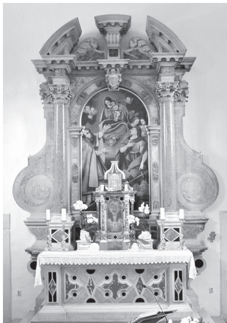
Slika 2: Giuseppe Cavallieri, glavni oltar, župna crkva svetog Silvestra Pape, Kanfanar, 1707.

Analiza Cavallierijevih oltara ukazuje na to da je majstor poznao uobičajene arhitektonske sheme venecijanskih slavolučnih oltara 17. stoljeća, na prvome mjestu Baldassarea Longhena, Giuseppea Sardija ili Alessandra i Paola Tremignona. No, stroge te, u tektonskom i dekorativnom smislu, klasične venecijanske oltare,