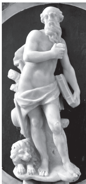
Slika 7: Venecijanski kipar, sveti Jerolim, crkva svetog Jerolima, Martinšćica