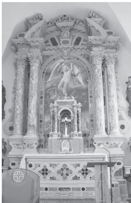
Slika 3: Giuseppe Cavallieri, glavni oltar, župna crkva svetog Mihovila, Žminj, 1706.

Oltari Cavallierijeve radionice, kao i inačice koje su iz nje izašle, postali su prepoznatljivi ne samo u Istri već i na otoku Krku. Takav je slučaj oltara Gospe od Ružarija u crkvi svetog Apolinara u Bogovićima, a koji se ovdje također može pripisati Cavallieriju. (sl. 4) Oltar je podignut 1709. za uprave Zuannea Balbija. 16 Zamišljen je poput slavoluka s četirima stupovima, dvjema nišama za kipove u interkolumniju i središnjom lučnom palom. Nad prekinutim gređem s kontinuirajućim vijencem i naglašenim obratima smješten je segmentni polukružni zabat, a nad njime istaci s mesnatim viticama i središnjim postamentom, također ukrašenim viticama. Cavallieri se za retabl oltara mogao ugledati na onaj glavni u venecijanskoj crkvi San Zulian, koji je podigao Giuseppe Sardi u sedmom desetljeću 17. stoljeća, a skulpturama u interkolumniju ukraasio Antonio Raffaelli. 17 U krčkom slučaju preuzeta je samo idejna shema, dok su kipovi naatici najvjerojatnije postavljeni naknadno. Ove se kvalitetne skulpture svetog Dominika i svetog Antuna Padovanskog mogu pripisati radionici poznatog venecijanskog kipara Paola Callala (Venecija, 1655. – 1725.).