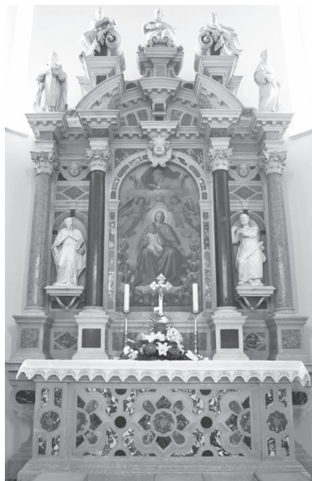
Slika 4: Giuseppe Cavallieri, oltar Gospe od Ružarija, župna crkva svetog Apolinara, Bogovići, 1709.