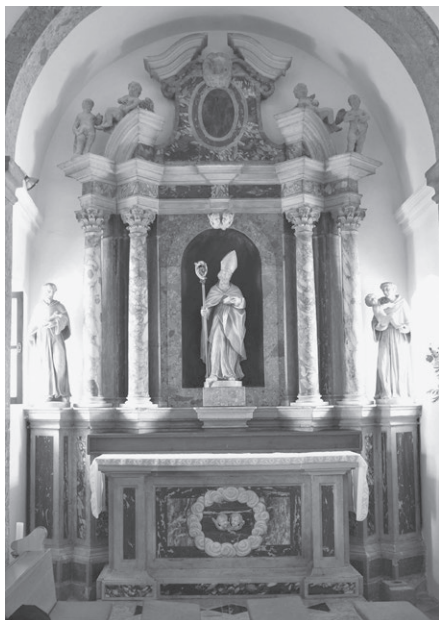
Slika 5: Antonio Michelazzi, oltar svetog Nikole, crkva svete Marije Magdalene, Porat