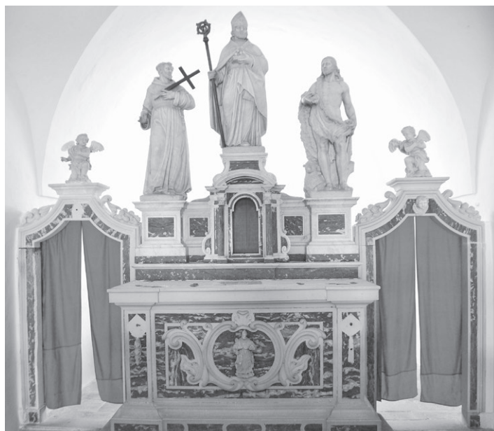
Slika 9: Glavni oltar s kipovima svetog Franje, Nikole i Ivana Krstitelja, crkva svetog Nikole, Porozina, 1747.

slika s prikazom Bogorodice i svetog Antuna Padovanskog iz radionice slikara Baldassarea D'Anne (oko 1572. – 1646.), djelatnog u Veneciji. 30