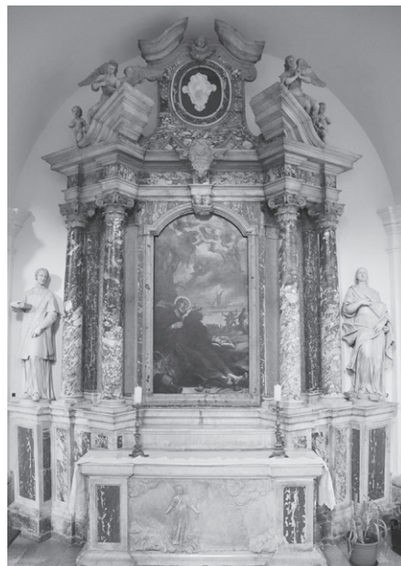
Slika 6: Antonio Michelazzi, oltar svetog Franje Ksaverskog, Katedrala, Senj, 1738.