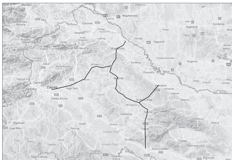
Karta 2: Pavlešov prijedlog rekonstrukcije trasa Kolomanove ceste

sa spomenom ove ceste teško povezati u jedan pravac te da mora biti riječ o nekoliko različitih trasa. On pretpostavlja da je jedan pravac vodio od prijelaza na Dravi preko Koprivnice i Jagnjedovca te možda nastavljao prema Ravenu (kod Križevaca), a drugi bi pravac od Rovišća išao preko mosta na Česmi i dalje na jug. Na ovaj bi se drugi pravac priključivao i krak iz smjera istoka, s gornjeg toka Česme, te moguće i onaj s juga, koji dolazi iz Pakraca.