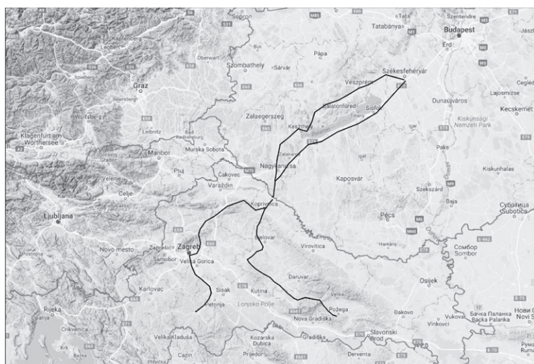
Karta 3: Vojne ceste na području Mađarske s ishodištem u Stolnom Biogradu prema srednjovjekovnoj Slavoniji te prijedlog rekonstrukcije trase Kolomanove i vojne ceste na području srednjovjekovne Slavonije prema M. Szilágyi

pohode prema Hrvatskoj s početka 12. stoljeća. 10 Prema spomenu ceste u izvorima, Szilágyi rekonstruirao trasu na sljedeći način: Jagnjedovac – Rovišće – Čazma – Pakrac – Požega te pretpostavlja da se taj pravac odvajao od vojne ceste nakon prelaska Drave kod Žakanja u blizini Koprivnice. Vojne ceste su, prema istoj autorici, povezivale utvrde i značajnije strateške pozicije u Ugarskom Kraljevstvu. 11 Među primjerima vojnih cesta navode se i dva pravca s ishodištem u Stolnom Biogradu, koji su vodili prema srednjovjekovnoj Slavoniji i Hrvatskoj: jedan je pravac prolazio kroz Šomođski komitat, istočno od Balatona, a drugi je prolazio Komitatom Zala, zapadno od Balatona. Szilágyi smatra da su oba pravca prešla preko Drave kod Žakanja te da se na području današnje Hrvatske može detektirati samo jedan pravac vojne ceste, koji je krivudao povezujući mjesta Bracon (?!), Selnica, Bokonue (?!), Kašina, Zagreb, Petrinja, Glina. Od spomenutih dvaju pravaca u Mađarskoj, autorica smatra da je ovaj istočniji, preko Šomođskog komitata, bio stariji jer se u izvorima spominje u drugoj polovini 11. stoljeća te da se vjerojatno koristio za vojna osvajanja Hrvatske i Dalmacije u vrijeme kraljeva Ladislava i Kolomana.