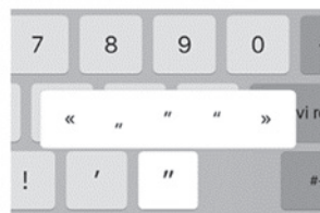
Slika 6. Navodnici na virtualnoj tipkovnici iOS 9 sa zrcalnim tipom fonta.

svih postojećih razgodaka jedino je oznaka za navodnik i polunavodnik kurzivizirana. Prema mišljenju autora ovoga istraživanja, zrcalni fontovi bitno su nečitljiviji u brzome pisanju u stvarnim uvjetima. Potrebno je dobro se zagledati u male mobilne zaslone i izgubiti na vremenu da bi se uočila razlika između završnoga navodnika ” i “, što je vidljivo na slici 6.