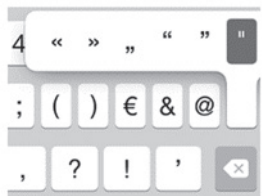
Slika 5. Navodnici na virtualnoj tipkovnici iOS 8 sa zaokrenutim tipom fonta.