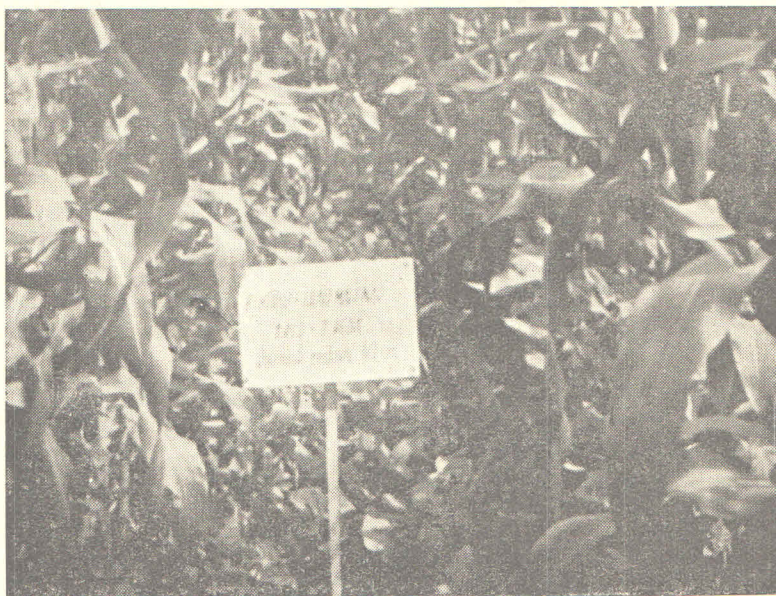
Na imanju Zavoda za ratarstvo, Botinec

U pogledu tehnike i primjene tehnike treba nastaviti ovaj put, koji su naši drugovi na terenu ozbiljno prihvatili i ozbiljno njime krenuli, i treba pomoći i organizirati tehničku pomoć tim našim drugovima koji neposredno rade da savremenu tehniku najracionalnije upotrebe. Mi se ni u tome ne možemo do kraja pohvaliti. Mi smo negdje krenuli sa 2,5—3.000 kilograma umjetnog gnojiva, a možda je trebalo 900 kg po 1 hektaru. Nama nevjerovatno brzo raste stočni fond na poljoprivrednim dobrima i ekonomijama a i produktivnost. Ali trebat će stvarno naučno prići problemima i vidjeti da za onu proizvodnju koju želimo, uz ocjenu mogućnosti pojedinih kultura i životinja za taj kapacitet, osiguravamo hranu. Treba osigurati dovoljno hrane za maksimalnu proizvodnju; ali ne rasipati, nego jeftino proizvoditi i štedjeti.