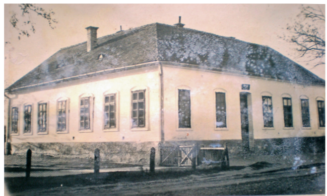
Sl. 1 Stara pučka škola u Ždali 1899. g.

O odgojnom i prosvjetiteljskom djelovanju Crkve možemo iščitati iz ljetopisa škola, a posebice iz zapisnika Društva sv. Josipa u Ždali. Iz zapisnika je vidljivo da su se svećenici angažirali u pouci mladih nakon završetka osnovne škole i opetovnica . U razdoblju od 1910. do