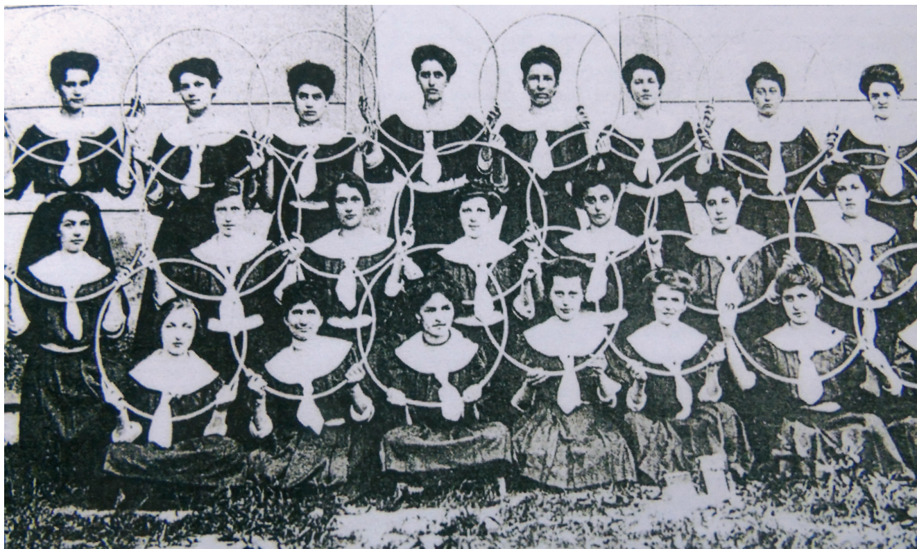
Sl. 3 Članice Hrvatskog sokola Gornji grad* Fig. 3 Female members of the association Hrvatski sokol, Upper Town