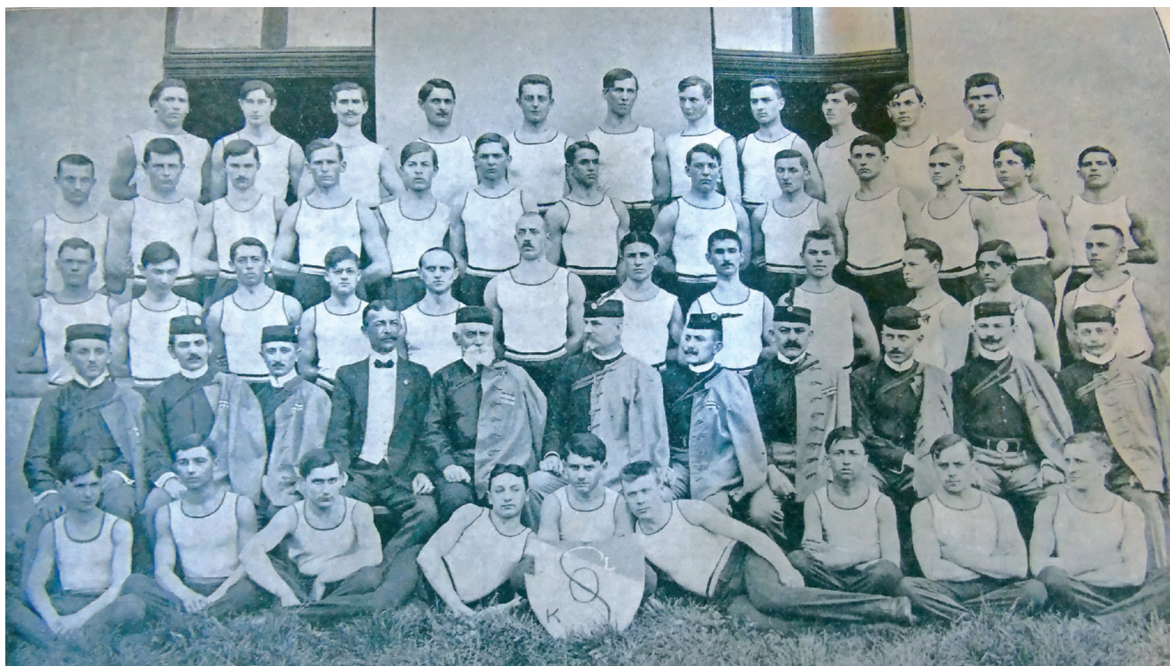
Sl. 4 Članovi Hrvatskog sokola Donji grad** Fig. 4 Male members of the association Hrvatski sokol, Lower Town