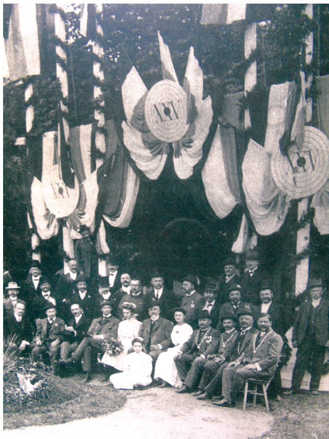
Sl. 1 Članovi Gradanskog streljačkog društva u Gradskom vrtu prigodom obilježavanja 125. obljetnice djelovanja, 1910.

Fig. 1 Citizen's Shooting Sport Association members celebrating its 125 th anniversary in Gradski vrt park, 1910