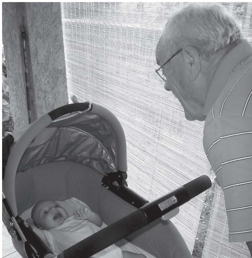
Bake i djedovi mogu biti izvor emocionalne podrške djetetu

Važnost utjecaja baka i djedova u životu