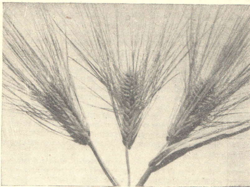
Slika 2. Križanac Stella x Ksenia ječma ima oblik buzdovana, jako busa i mnogorodan je

Rad na »Unutarsortnom križanju pšenice« prikazan je i objavljen u »Biljnoj proizvodnji« br. 5—6 za god. 1949. Pokusi s ovom vrsti križanja pokazali su, da unutarsortna bastardacija autogamih individuuma povećava prinose, te da je to jedan od agrotehničkih zahvata, kojim se mogu povećati prinosi na oranicama.