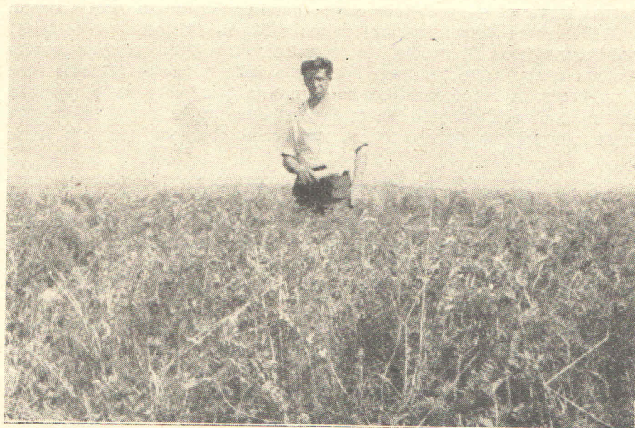
Sl. 7. Pogled na pokusno polje ozime krmne smjese, grahorice i zobi, koja je imala četverogodišnje prosjeke prinosa 221,25 mtc zelene mase po hektaru.

Rad s viciom narbonensis dao je u Poreču pozitivne rezultate. Sjetva je obavljena 26. IV., a početak nicanja primijećen je 10. V. Biljke su se dobro razvijale, a bile su snažne i mesnate konstitucije. Cvatnja je primijećena 2. VII., a žetva je obavljena 28. VIII. Prosječna visina biljaka bila je 40 centimetara. Smatramo, da se vicia narbonensis može u Istri, unatoč suši, uspješno uzgajati.