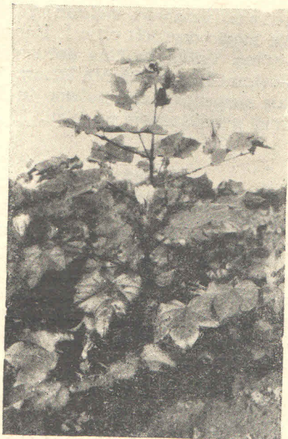
Sl. 6. Detalj pokusnog polja s pamukom

forsiran uzgoj pamuka u Istri, u razdoblju između god. 1948. i 1950. U Poreču je s pamukom postignut loš uspjeh, jer se pokazalo, da je to slabo rodna i nerentabilna kultura. Najveći prinos postignut je god. 1949., kada je dobiveno 170,5 kilograma zrna i pamučike zajedno, po hektaru. Nasuprot, u Fažani je pamuk dao vrlo dobre rezultate, jer su tamo raspolagali s vjerovatno ranije zrelim sortama, ili mu je mikroklima više pogodovala. Smatramo, da je Poreč još najsjevernija granica, gdje pamuk može još kako-tako uspijevati.