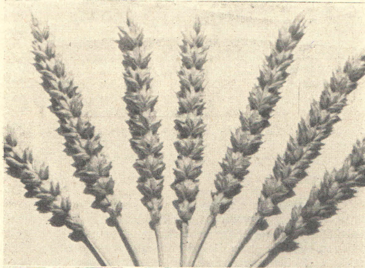
Slika 1. Pšenica Mentana x Regalia proizvedena je na Srednjoj poljoprivrednoj školi u Poreču

zatim o pokusima sa zrnatim mahunjačama i biljkama za tehničku preradu, a na koncu o rezultatima, dobivenim prilikom pokusnog rada s biljem za proizvodnju stočne hrane.