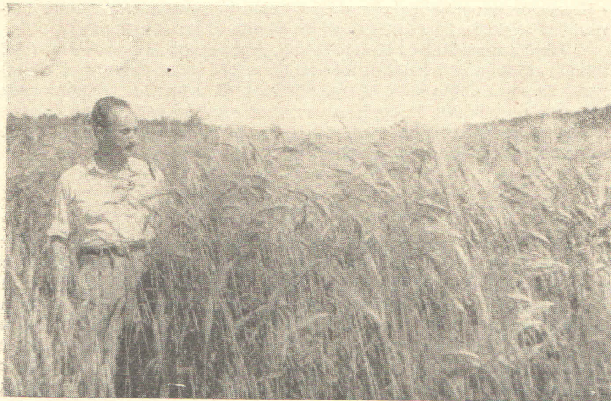
Sl. 3. Pogled na pokusno polje Ksenia ječma (četveroredca). U lijevoj kuti slike vidi se okrajak pokusnog polja sa pšenicom Mentana x Regalia .

Pokusi s bastardacijom ječma u Poreču, dali su najznačajnije rezultate. Na Srednjoj poljoprivrednoj školi u Poreču uzgojene su sorte ječma, koje rode 4 do 5 puta više od 10-godišnjeg prosjeka uroda u kotaru Poreč, koji iznosi 8 do 9 mtc po hektaru.