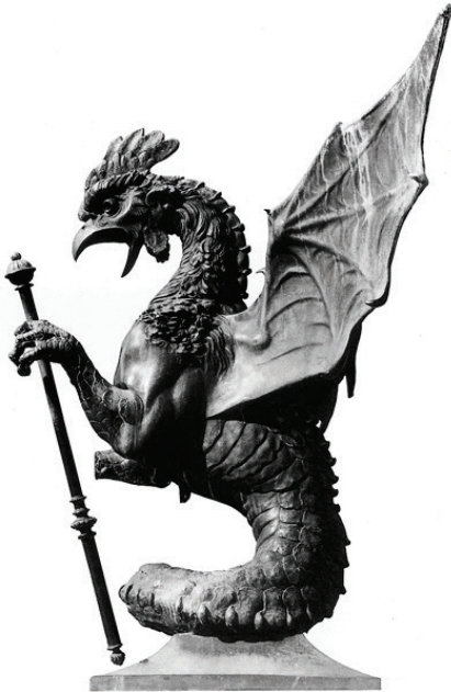
Sl. 4. A. D. Fernkorn, Bazilisk , 1864.

wFernkornov značaj u hrvatskoj memorijalnoj plastici nije samo u skulpturama koje je izveo za naše područje već i u izravnom ili neizravnom utjecaju koji su njegovi radovi imali. Najbolje se to ocrtava pri usporedbi njegova Lava iz Asperna i hrvatskog Viškog lava (Prirovo na Visu) čiji je autor također bio stranac. Lav iz Asperna isklesan je u spomen poginulima u prvoj Napoleonovoj neuspješnoj bitki te je zasigurno bio oblikovni i namjenski uzor za podizanje spomenika Žrtvama viškoga boja koji su Talijani za vrijeme okupacije odnijeli u Livorno. 20 Ovdje valja istaknuti i činjenicu da Fernkorn ovdje djeluje kao svojevrсни medij, njegova ideja o oblikovanju Lava iz Asperna uvelike je bila određena Thordwaldsenovim Lavom iz Luzerna. Fernkorn je određeno vrijeme surađivao s Thordwaldsenom te se njegovim posredništvom oblikovne ideje Thordwaldsena šire i do jadranskog otočja.