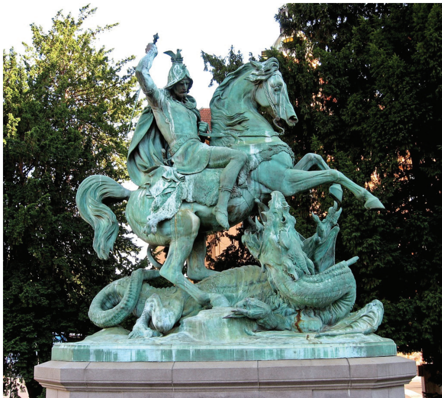
Sl. 2. A. D. Fernkorn, Sv. Juraj ubija zmaja, 1853.

Postavljeni su na zdenac koji je projektirao Bolle 1873. godine, pozlatu je izveo zagrebački zlatar Wagmeister. 13 U razdoblju od 1. ožujka 1866. do 3. studenog 1887., Fernkorn vlasništvo nad svojom radionicom prepušta suradnicima Rochlichu i Ponningeru. 14 Time je i model Marie Immaculate prešao u njihovo vlasništvo.