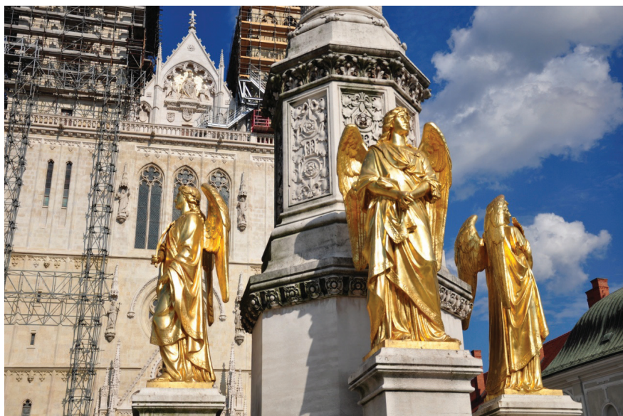
Sl. 3. A. D. Fernkorn, Maria Immaculata, anđeli , postavljeno 1882.