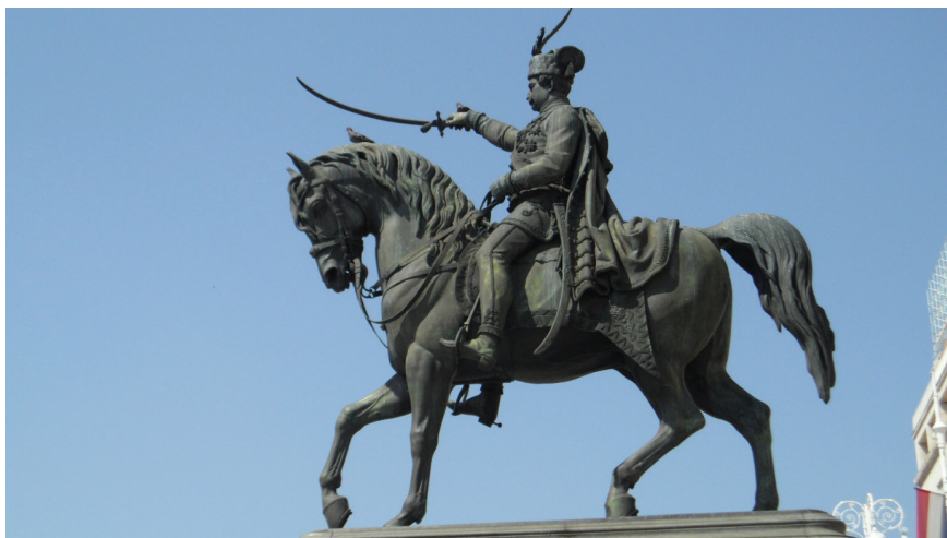
Sl. 1. A. D. Fernkorn, Spomenik banu Josipu Jelačiću, 1866.

Smjer u kojem će spomenik stajati odredio je Fernkorn. Nakon što je dovršio svoj rad 1865., dok još nije bio dopremljen u Zagreb, poslao je dopis Odboru u kojem im sugerira da skulpturu okrenu prema življem, važnijem dijelu grada, kao što je to običavao činiti i s drugim svojim statuama. Bilo je poznato da je Bolle imao u planu daljnji razvoj Kaptola. Fernkorn je smatrao da će se grad širiti radijalno od