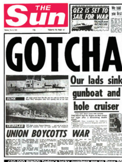
Naslovnica novina The Sun 4. svibnja 1982.

Kretanje britanskih i argentinskih snaga (izvor: „ The Falklands Campaign: Distances of Bases “ u United States Military Academy , www.usma.edu , 17.2.2015.)