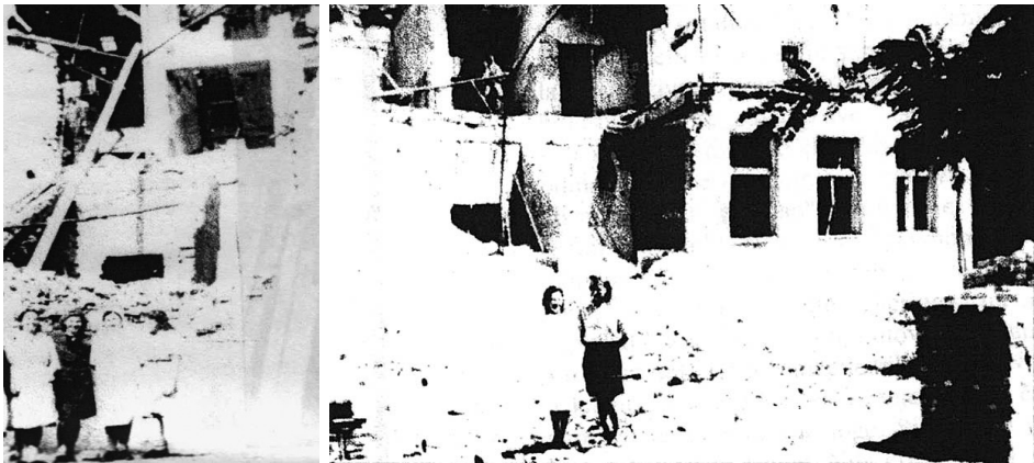
Slika 3. Centar grada bombardiranjima je većinom pretvoren u ruševine (lijevo). Uslijed bombardiranja oštećene su zgrade današnjega Zaraznoga i Kožnoga odjela te Neuropsihijatrije (desno).