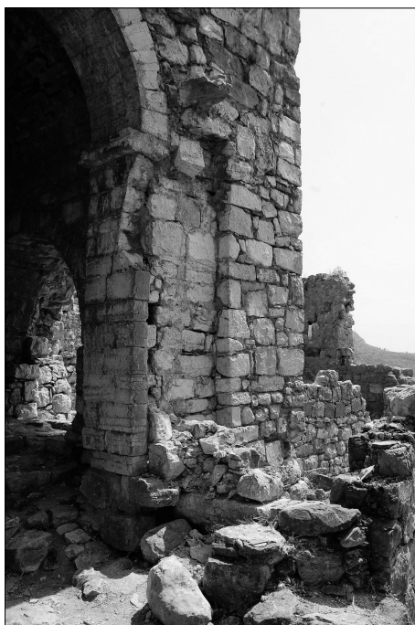
Sl. 1. Stari grad Bar: ulični prolaz zasveden crkvom koja potiče iz XIV. vijeka (»nazvana danas crkvom Sv. Katarine«; Đ. Bošković, Stari Bar , str. 24)

Nadalje, u istom, dramatičnom izvještaju, nadbiskup Bizzi navodi »osjećaj slabe sigurnosti u mome stanu u Baru« 33 . Može se zaključiti da je njegovo boravište vjerovatno bilo smješteno nedaleko od crkve sv. Ilije, ako ne u istom građevinskom sklopu. »Kako moj boravak u Baru nije bio siguran, nijesam nikad izlazio iz kuće niti sam dozvoljavao članovima moje porodice da bez potrebe šetaju gradom, a nijesam ni ja izlazio osim u crkvu , gdje se, naročito u dane svetačke, očekivalo da napasem one duše čestim davanjem sakramenata i, kako sam naprijed rekao, čestim propovijedima.« 34