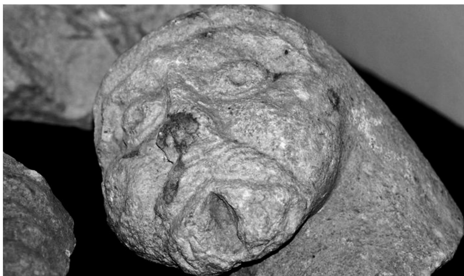
Sl. 4. Stari grad Bar: fragment skulpture s katedralnog portala, XIV. stoljeća

Uz crkvu Gospe izvan zidina koja je opustošena 1631., crkva sv. Ilije je najduže bila u upotrebi katoličkih vjernika, ali je u njoj 1633. godine već bilo zabranjeno sahranjivanje. U prvom izvještaju Kongregaciji barskog nadbiskupa Marka Jorge od 15. juna 1697. godine navodi se da je u Baru, pored katedralne, »unutar svojih zidina« bilo »više od pet crkava: sv. Pavla, sv. Petra, sv. Marka, sv. Ilije, sv. Venerande i jedan samostan