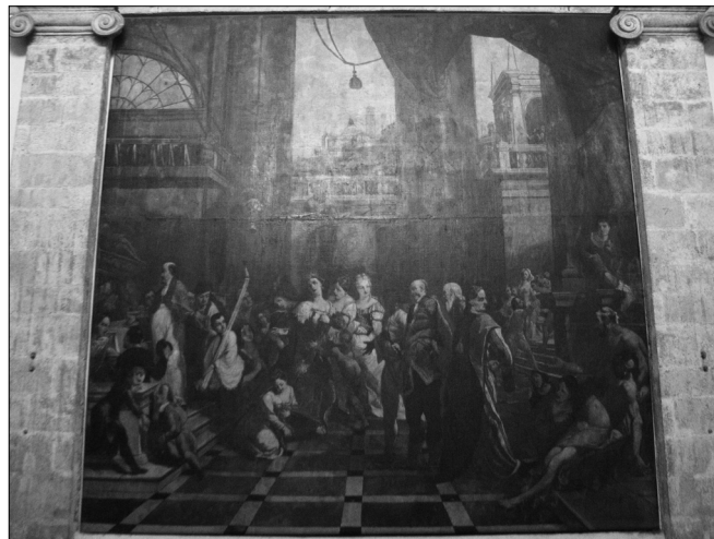
Sl. 1. Kompozicija s prikazom kraljičine krađe prsta sv. Šime i oslobađanja opsjednutog Zadrana od demona.

Međutim, valja imati na umu da je u vrijeme narudžbe zadarskoga ciklusa Venecija bila habsburška saveznica u ratu s Osmanlijama, a ne neprijateljica. Stoga povijesne kompozicije s likom anžuvinskoga kralja i kraljice u prostoru svetišta sv. Šime nisu nužno bile nepoćudne mletačkoj vlasti. Zmajević je očito mudro procijenio koji su historiografski sadržaji tada mogli biti politički primjereni u svetištu komunalnog zaštitnika.