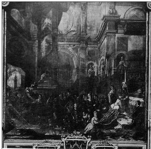
Sl. 3. Kompozicija s prikazom svečane ceremonije u prisutnosti ugarsko-hrvatskoga kralja Ludovika I. i kraljice Elizabete u kapeli sv. Šime u crkvi sv. Marije Velike u Zadru; preuzeto iz: Radoslav Tomić, »Slikarstvo talijanskog baroka u Hrvatskoj«, u: Sveto i profano: slikarstvo talijanskog baroka u Hrvatskoj , katalog izložbe, Galerija Klovičevi dvori, Zagreb, 16. travnja – 2. kolovoza 2015., str. 16.