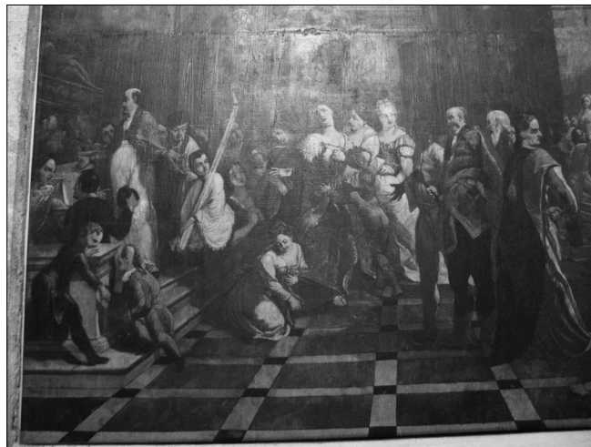
Sl. 2. Detalj kompozicije s prikazom kraljičine krađe prsta sv. Šime i oslobađanja opsjednutog Zadrana od demona.