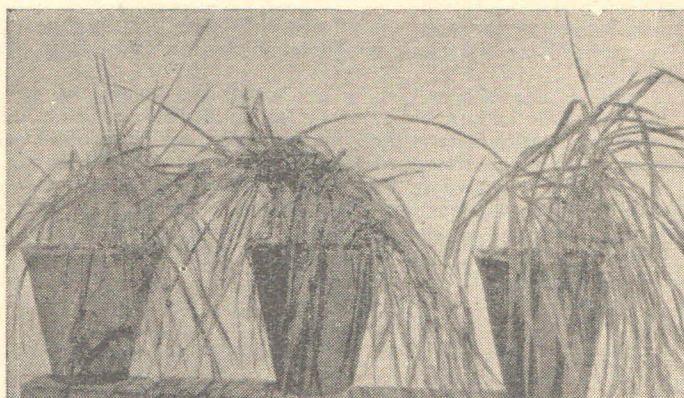
C-sorta Leonardo levo na zemljištu iz okoline Smedereva, u sredini na zemljištu iz okoline Pančeva, desno na sterilnom zemljištu