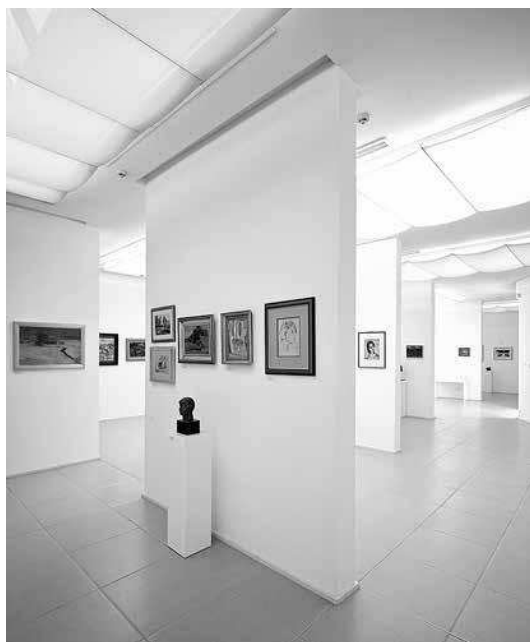
sl.2.-9. Galerija "Šimun": stalni postav Zbirke moderne i suvremene umjetnosti.