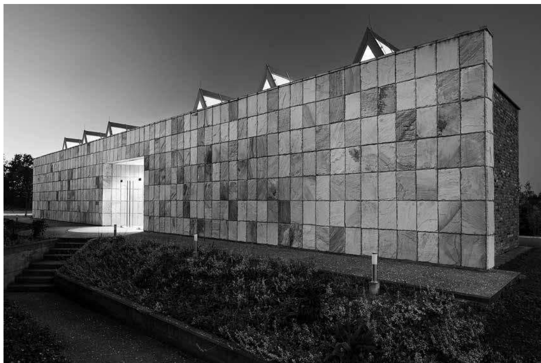
sl.1. Zgrada Galerije "Šimun" Franjevački samostan sv. Ante u Dubravama, Bosna i Hercegovina

VIŠNJA ZGAGA □ Muzejski dokumentacijski centar, Zagreb