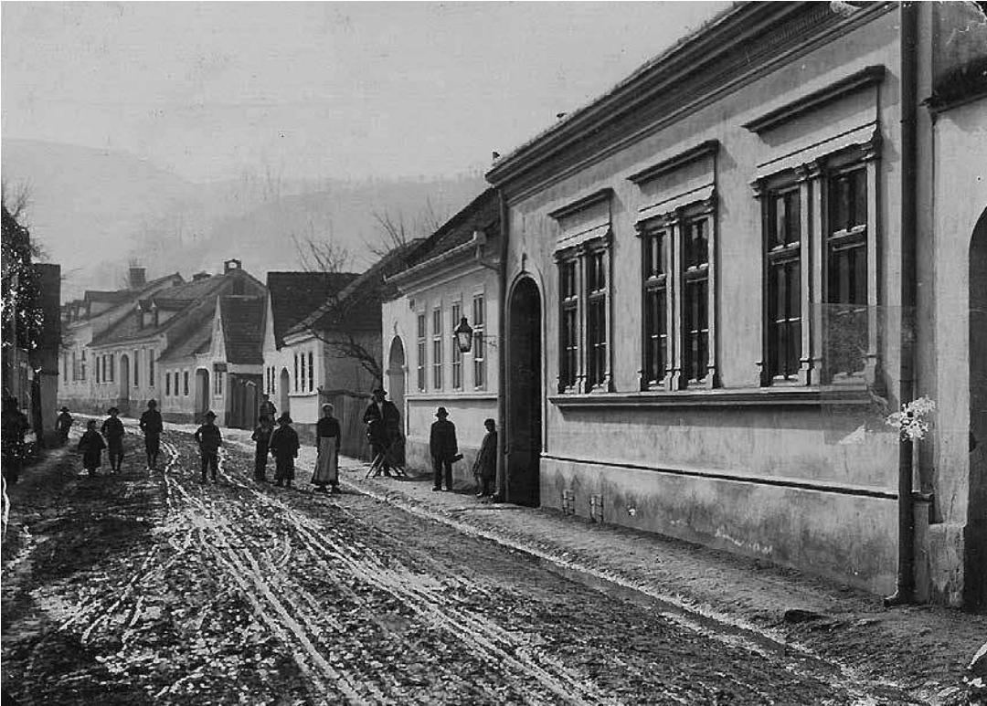
sl.4. Kuća obitelji Kempf, početak 20. st.

društva, Građanskoga streljačkog društva).