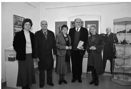
sl.7. Izložba Donacija obitelji Kempf postavljena uz Međunarodni dan muzeja 2014.