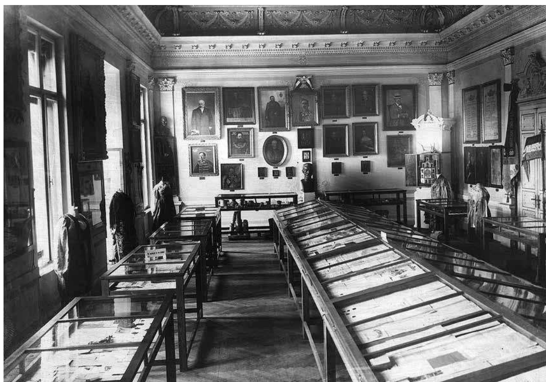
sl.3. Prvi stalni postav Gradskoga kulturno-historijskog muzeja u Požegi 1930.