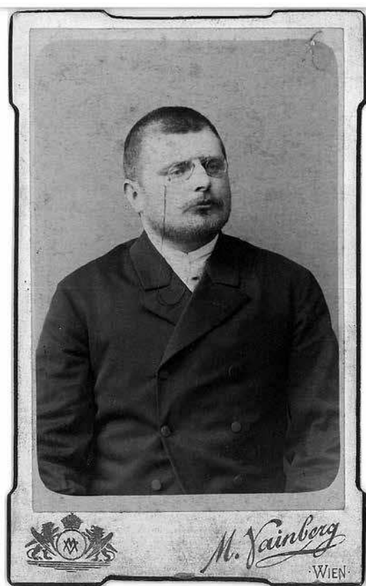
sl.1. Julije Kempf potkraj 19. st.

Već krajem 19. st. Kempf je naveliko radio na svom kapitalnom djelu Požega, zemljopisne bilješke iz okoline i prilozi za povijest slob. i kr. grada Požege i Požeške županije . Radio je dulje od desetljeća, istraživao u stranim i domaćim arhivima te knjigu objavio 1910. To je monografija kakvom se malo koji grad mogao pohvaliti. Kempf se do tada već bio i dokazao u znanstvenim krugovima te se svojim aktivnostima izdigao izvan lokalnih granica. Od 1903. postao je povjerenik Kraljevskoga zemaljskog arhiva u Zagrebu (do 1910. uzorno je sredio arhivsku građu o povijesti Požeške županije od 18. do sredine 19. st.). Od 1905. bio je povjerenik Matice hrvatske, okupio je u njoj brojne članove i za svoj je rad imenovan članom radnikom te je dobio priznanje. Od 1906. bio je povjerenik Društva za hrvatsku prosvjetu.