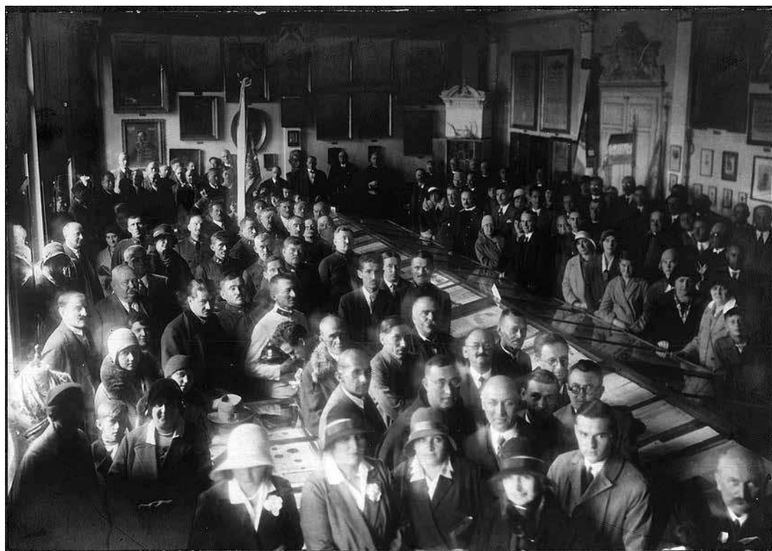
sl.2. Svečano otvorenje prvoga stalnog postava Gradskoga kulturno-historijskog muzeja u Požegi, 19. listopada 1930.