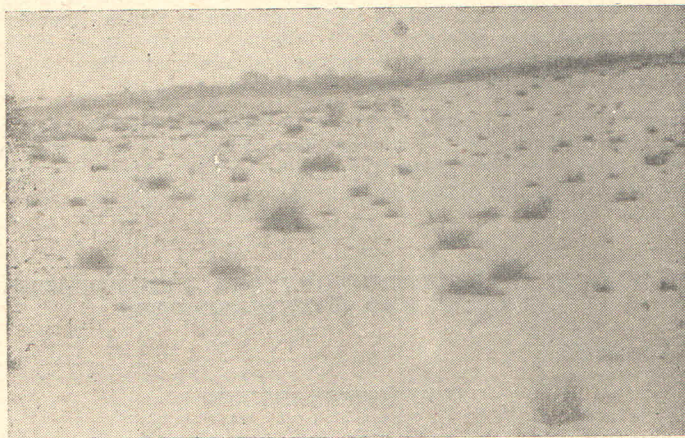
Sl. 1 — Karakterističan izgled terena pod peskom s oskudnom vegetacijom (Ramska Peščara)

Dosada su na peščarama provedena pedološka (Pavičević, — Stanković, 1955), floristička (Stjepanović — Veseličić, 1953), a u zadnje vreme i entomološka istraživanja (Stančić, Gradojević, Petrik). U entomološkim istraživanjima najviše nas je zanimao sastav, poreklo i karakter faune insekata. Na ovim pitanjima smo vršili sistematska istraživanja duži niz godina, osobito na području Ramske Peščare. Slična istraživanja smo provodili, ali u manjem obimu, i u Deliblatskoj, pa i Subotičkoj Peščari. Pritom najbolje je istražena fauna Coleoptera koja zasada broji preko 1500 vrsta, a zatim Hemiptera, sa oko 200 vrsta