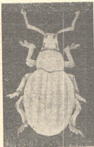
Sl. 5 — Vrsta Peritelus familiaris Boh. — štetna pipa na voćkama i vinovoj lozi (Subotička Peščara).

Iz roda Anisoplia dve vrste se mogu označiti karakterističnim štetočinama za peskovite terene: Anisoplia deserticola Fisch. i Anisoplia segetum Hbst. Prva je jedna od najtipičnijih psamofilnih vrsta koju ne susrećemo ni na jednom drugom terenu van peskova. Rasprostranjena je samo u Deliblatskoj i Ramskoj Peščari, gde je tek nedavno i prvi put za našu zemlju — utvrđena. Pripada pontijskoj fauni. Javlja se u vrlo velikom broju na žitima i klasatim travama. Njene grčice su takođe brojne i mada malih dimenzija, nema sumnje, ipak nanoše izvesne štete kulturama koje se gaje na pesku. Druga vrsta — Anisoplia segetum , iako rasprostranjena svuda, na terenima pod peskom se javlja u puno većem broju, jer su to za nju idealna staništa. U Deliblatskoj i Ramskoj Peščari je srećemo mnogo češće nego u Subotičkoj — ima ga na žitima i travama, a grčice u zemlji na korenu ovih i drugih biljaka.