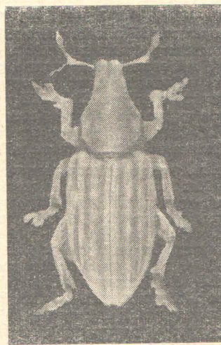
Sl. 6 — Kukuruzna pipa — Tanymecus dilaticollis Gyll., štetočina vinove loze na peskovima

Dalje, kao štetočine kultura gajenih na pesku, dolaze predstavnici familije skočibuba — Elateridae . Veći broj vrsta se javlja na peskovima, ali je samo jedna izrazito štetna. To je Melanotus punctolineatus Peler. Žičnjaci ove vrste napadaju razne kulture, ali su najštetnije za vinovu lozu, jer se ubušuju u mlade lastare pod humkom, (u prvoj godini podizanja vinograda), te mogu u znatnom procentu da ih unište. Osobito se javljaju u velikom broju na površinama koje se prvi put razoravaju, a bile su pod travnim pokrivačem. Ova vrsta je najbrojnija u Deliblatskoj, a zatim u Ramskoj Peščari. Iako se na peskovima susreću i druge vrste ovog roda ( Melanotus crassicollis Er., M. brunripes Germ. (ni jedna od njih nije štetna. Specifične za peskovite terene su, takođe neke vrste roda Cardiophorus , ( C. rufipes Geoffr., C. rubripes Germ., C. cinereus Hrbst.), ali i pored toga što ih katkada nalazimo u priličnom broju, ne predstavljaju gotovo nikakvu opasnost za kulture, jer je intenzitet ishrane njihovih larvi veoma slab.