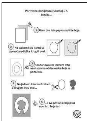
sl.1.-2. Materijal popratne edukativne radionice: jedan od ukupno pet izrađenih radnih zadataka i otisnutih na ploči tzv. kapafixu i Upute za izradu portreta u 5 koraka.

Etimologiju riječi silueta treba tražiti u vremenu kad je francuski ministar financija bio Étienne de Silhouette, koji je sredinom 18. st., u nastojanju da napuni državnu blagajnu, uveo visoke poreze na luksuz. Naime, u to su se vrijeme mnogi plemići koji su dotad naručivali raskošne portrete bili prisiljeni odlučiti za minijaturene portrete koji su plošno i jednobojno prikazivali portretirane osobe. Izazivajući u to vrijeme porugu, dobivali su naziv à la silhouette , a izraz se proširio i našao odgovarajuće značenje u mnogim jezicima.