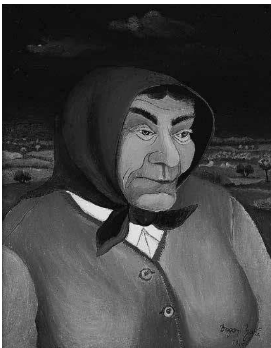
sl.4. Mirko Virius: Japa , 1939., ulje, platno, 600 x 470 mm