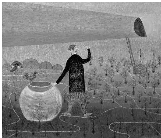
sl.10. Ivan Rabuzin: Put , 1964., ulje, platno, 540 x 650 mm