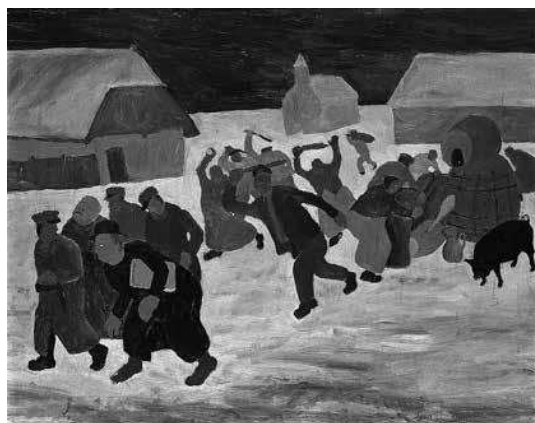
sl.3. Ivan Večenaj: Japa ido s pijaca , 1962., ulje, staklo, 500 x 655 mm