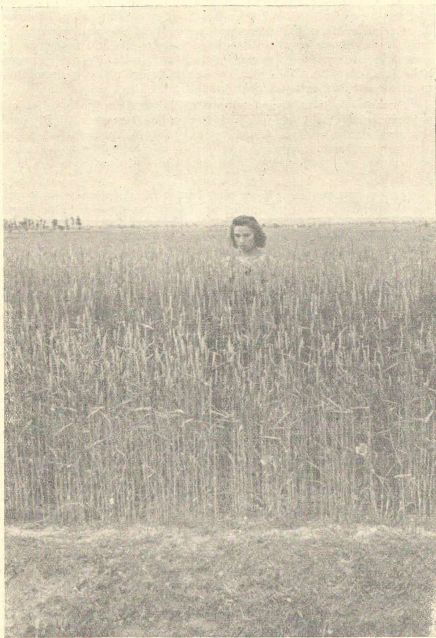
OSJEČKA ŠIŠULJA — tip visoke sorte za srednju produkciju po hektaru