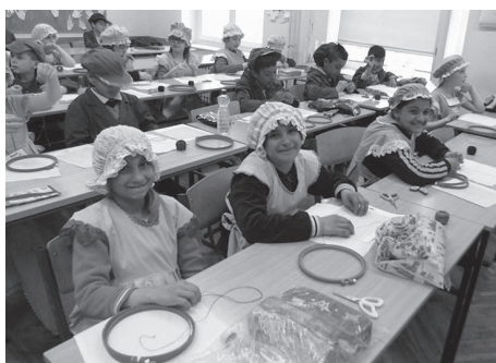
Radionica Zajedništvom do tolerancije