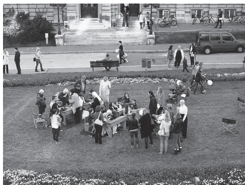
Bijela noć – radionice

Jesen smo dočekali prigodnim programom Bijela noć , koja je održana u sklopu Rendez-vous Festivala Francuske u Hrvatskoj . Posjetitelji su mogli uživati u klupama radeći zlatovez, vezenje križićem ili strip na radionicama nastalim u suradnji sa Ženskom općom gimnazijom Družbe sestara milosrdnica te Studijem Tanay . Prikazivao se i film Noć u Školskom muzeju foto video grupe OŠ Josipa Jurja Strossmayera . Veliko zanimanje pobudila je izložba Udruge Titanic 100 koja je bila upriličena samo za ovu noć, kao i predavanja gospodina Alije Pozderca , predsjednika Udruge Titanic 100 te gospodina Slobodana Novkovića , titanikologa koji se preko 35 godina bavi fenomenom Titanica .