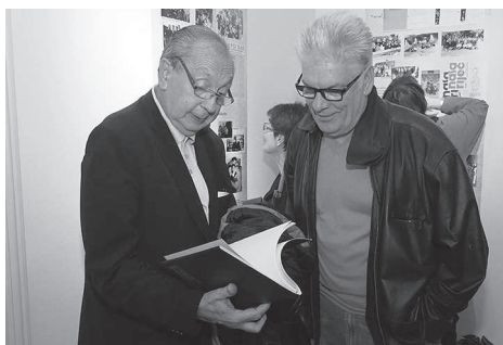
105 godina Šibenske gimnazije

nepoznatim detaljima vezanim uz kalvariju Titanica , o putnicima iz Hrvatske koji su bili na brodu te o ulozi hrvatskih pomoraca s broda Carpathia , koji je Titanicu prvi došao u pomoć. Istražujući povezanost Titanica i Carpathije , autori izložbe došli su i do nevjerojatnoga otkrića spasilačkoga prsluka s Titanica koji se danas čuva u Pomorskom i povijesnom muzeju Hrvatskoga primorja u Rijeci i jedini je od pet sačuvanih prsluka koji se nalazi u Europi.