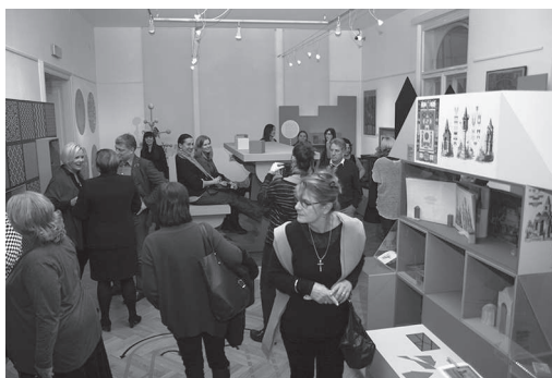
Izložba Zagrebačka zabavišta