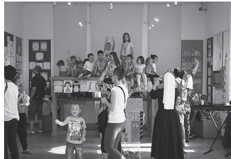
Izložba Vjerom osvijetljen prostor