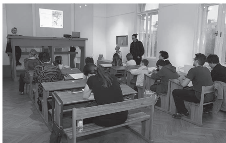
Europska noć muzeja

ožujka i početkom travnja Školski muzej gostovao je u Slavonskom Brodu, gdje je u organizaciji s Fakultetom za odgojne i obrazovne znanosti u Osijeku , dislocirani studij u Slavonskom Brodu , brodskim harmonikaškim orkestrom Bela. pl. Panthy i Udruženjem Roma Ludari rumunjskog porijekla Slavonski Brod organizirao svoje radionice za učenike 3. i 4. razreda osnovnih škola iz Slavenskoga Broda. Sredinom travnja Muzej je organizirao radionice krasopisa i quillinga u Muzeju Brodskoga Posavlja , Slavonski Brod u sklopu programa “ U svijetu bajki Ivane Brlić-Mažuranić ”.