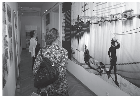
Izložba Titanic Carpathia

Ljeto 2015. u Hrvatskom školskom muzeju obilježila je izložba Titanic – Carpathia Pomorskoga i povijesnoga muzeja Hrvatskoga primorja Rijeka . Izložba je bila otvorena od kraja lipnja pa sve do 5. rujna, a vidjelo ju je preko 500 posjetitelja. Izazvala je i veliku pozornost medija. Autori izložbe su Nikša Mendeš iz Pomorskoga i povijesnoga muzeja Hrvatskoga primorja Rijeka te titanikolog Slobodan Novković . Izložba govori i o