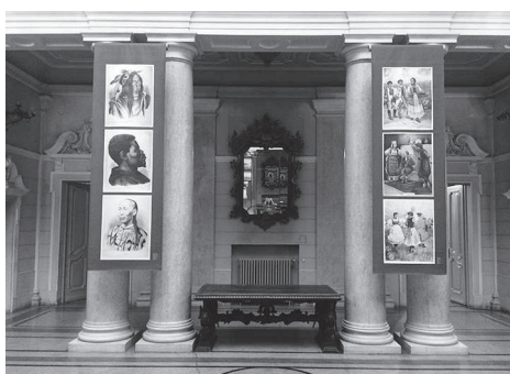
Pokretna izložba Kolorirane litografije

Pokretne izložbe Hrvatskoga školskog muzeja tijekom godine gostuju po cijeloj Hrvatskoj, a u 2015. na gostovanju su bile izložbe Kao Hlapić i Gita – Siročad u Hrvatskoj potkraj 19. i početkom 20. stoljeća , koja je gostovala do kraja siječnja na Odjelu za nastavničke studije u Gospiću, Sveučilište u Zadru, i Učiteljice i učitelji u Hrvatskoj 1849. – 2009. , koja je 2015. godinu dočekala na Učiteljskom fakultetu Sveučilišta u Zagrebu, Odsjek u Petrinji. Pokretna izložba Učiteljice i učitelji u Hrvatskoj 1849. – 2009. gostovala je i na Učiteljskom fakultetu Sveučilišta u Zagrebu te na njegovu odsjeku u Čakovcu. Na Fakultetu za odgojne i obrazovne znanosti Osijek, dislocirani studij u Slavanskom Brodu, u travnju je gostovala izložba Kao Hlapić i Gita – Siročad u Hrvatskoj potkraj 19. i početkom 20. stoljeća , a na kraju godine ova je izložba predstavljena i u Gradskom muzeju Požega u Požegi. Pokretna izložba Kolorirane litografije – Ilustrativna nastavna pomagala u zbirkama Hrvatskoga školskog muzeja gostovala