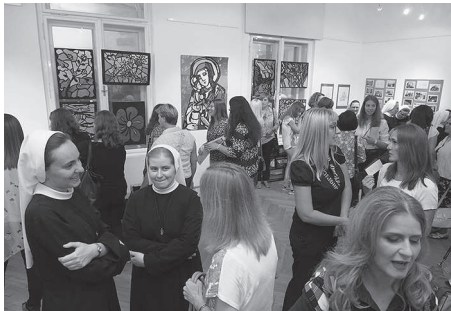
Izložba PRO DEO ET PATRIA