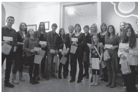
Dodjela nagrada Narita

Dugogodišnje sudjelovanje Hrvatskoga školskog muzeja na Međunarodnoj izložbi dječjega likovnog stvaralaštva Narita te Međunarodnom literarnom natječaju za mlade GOI u organizaciji Mirovne zaklade GOI iz Tokija u veljači je rezultiralo svečanom dodjelom diploma učenicima čiji su radovi nagrađeni, a diplome je podijelio veleposlanik Japana u Republici Hrvatskoj Njegova Ekselencija gospodin Keiji Ide .