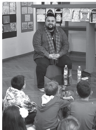
Što sam želio biti kad odrastem?

Svake godine najmlađe posjetitelje upoznajemo s raznim zanimljivim javnim osobama u sklopu programa Što sam želio biti kad odrastem? Ove nam je godine gost bio poznati pjevač Jacques Houdek , koji se krajem svibnja predstavio učenicima OŠ Josipa Jurja Strossmayera .