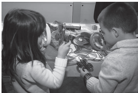
Noć muzeja - Vrtić 23. stoljeća

Povodom obilježavanja projekta Zajedništvom do tolerancije , krajem