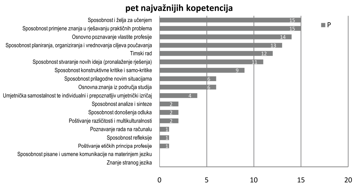
Slika 2. Distribucija odgovora o pet najvažnijih kategorija kompetencija