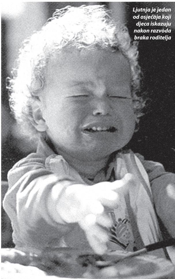
Ljuttja je jedan od osjećaja koji djeca iskazuju nakon razvoda braka roditelja

Dijete ima pravo na uzdržavanje od strane oba roditelja i ono je također regulirano sudskom odlukom. Prilikom određivanja visine koju je na ime uzdržavanja dužan uplaćivati roditelj koji ne živi s djetetom, razmatraju se ukupne mjesečne potrebe djeteta pri čemu se u obzir uzimaju djetetova dob, potrebe za obrazovanjem i vanškolskim, odnosno vanvrtičkim aktivnostima ili posebne potrebe, ukoliko ih dijete ima. Ministarstvo pravosuđa svojom odlukom utvrđuje okvirne iznose za uzdržavanje djeteta. Trenutno je na snazi odluka po kojoj je djetetu predškolske dobi mjesečno potrebno 1500 kn, a djetetu školske dobi 1700 kn za uzdržavanje. Navedeni se iznosi odnose na procjene ukupnih mjesečnih potreba djeteta, odnosno iznos koji su roditelji zajedno dužni osigurati djetetu. Prilikom određivanja visine uzdržavanja, roditelju koji živi s djetetom u visinu njegova doprinosa uračunava se rad i briga koju ulaže u podizanje djeteta. Važno je naglasiti da će u slučaju većih mogućnosti roditelja, doprinos za uzdržavanje također biti veći budući da djetetov standard slijedi životni standard roditelja.