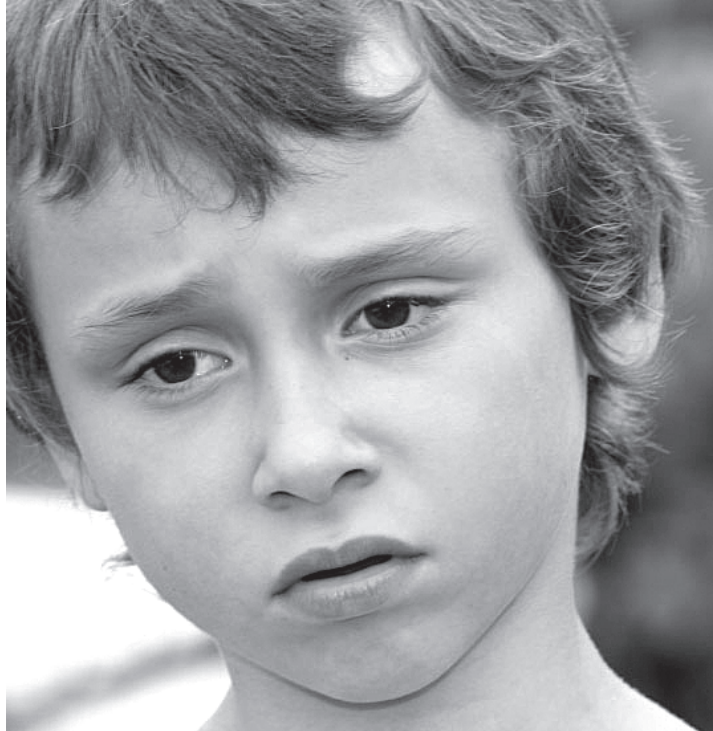
Važno je da dijete dobije jasnu poruku da ono nije krivo niti odgovorno za razvod svojih roditelja

Djetetove reakcije na razvod roditelja ovise o nizu faktora kao što su dob i zrelost djeteta, o djetetovom odnosu s pojedinim roditeljem, odnosu roditelja prije i tijekom razvoda, kao i o dostupnoj mreži socijalne podrške u obitelji i izvan nje. One mogu ići od dezorganizacije, napetosti, agresije, pretjeranog dokazivanja snage, do potpunog povlačenja od ljudi. Dijete može biti anksiozno, depresivno, tužno, bespomoćno, ljuto, posramljeno, zbunjeno, usamljeno, preplašeno, osjećati se krivim ili zaboravljenim. Djeca ponekad mogu burno reagirati na odlaske u vrtić zbog straha da će biti ostavljeni. Zbog svega toga potrebno je, bar određeno vrijeme, sačuvati poznata mjesta i navike (blizina braće i sestara, poznat vrtićki ambijent...), dosljednost u brizi, maksimalno zadržati rutinu na koju se dijete naviklo jer to djetetu daje sigurnost (zadržati isto vrijeme odlaska na spavanje bez