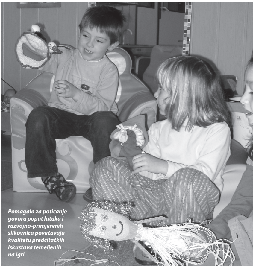
Pomagala za poticanje govora poput lutaka i razvojno-primjerenih slikovnica povećavaju kvalitetu predčitačkih iskustava temeljenih na igri

Strickland, 1997.; Christie, 1998.; Owocki, 1999.; Morrow, 2001.; International Reading Association, 2002.). Čuvena skupina stručnjaka koja se bavi razvojem predčitačkih vještina (Neumann i Roskos, 1993.; Goldhaber i dr., 1996.; Morrow, 1997.; Strickland i Strickland, 1997.; Christie, 1998.; Morrow, 2001.) otkrila je značajan učinak ranih predčitačkih iskustava na usvajanje predčitačkih vještina, a potom i na razvoj pismenosti kod te djece. Premda se to uvijek ne odnosi na 'čitanje' u formalnom smislu te riječi, izlaganje ovih pisanih materijala u okruženje u kojem borave djeca, pokazalo se kao važan preduvjet razvoja čitanja (Mason, 1980.; Goodman, 1986.). Zagovarači igre mogu se zauzeti za strategiju 'intervencije materijalima' koja uključuje uređivanje posebnih centara