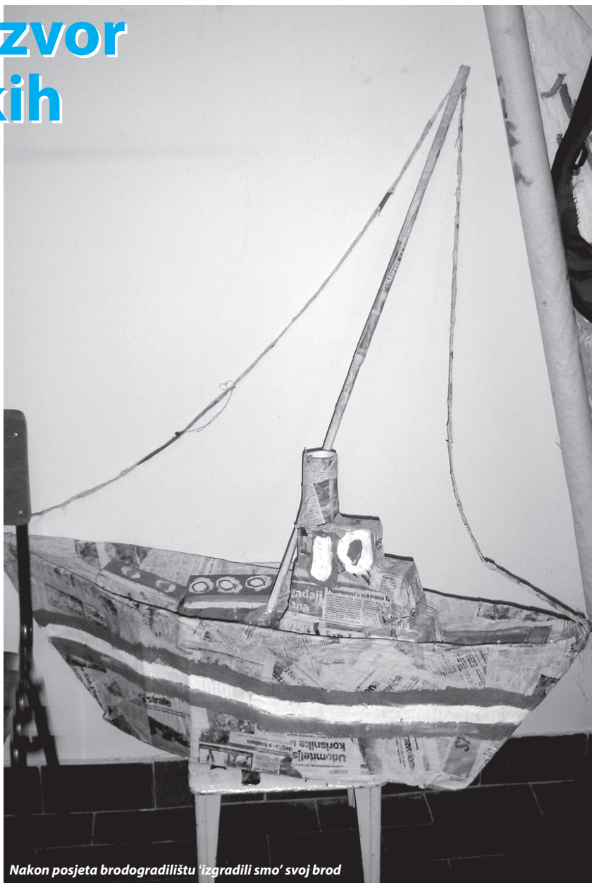
Nakon posjeta brodogradilištu 'izgradili smo' svoj brod

Vodeći se prirodnom dječjom znatiželjom i potrebom za otkrivanjem i istraživanjem, odgajateljice dječjeg vrtića Mirta provele su različite igre i aktivnosti vezane uz temu vode. Pročitajte kako se njihov projekt proširivao zahvaljujući velikoj dječjoj istraživačkoj motivaciji i kako je stvaralačka igra u njihovom vrtiću svakim danom postajala sve maštovitija.