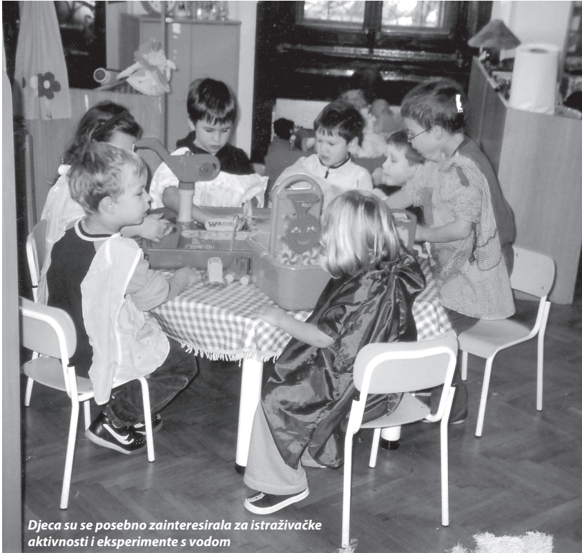
Djeca su se posebno zainteresirala za istraživačke aktivnosti i eksperimente s vodom

U ovom tekstu prikazat ćemo samo dio aktivnosti kojima smo se bavili istražujući ove zanimljive teme.