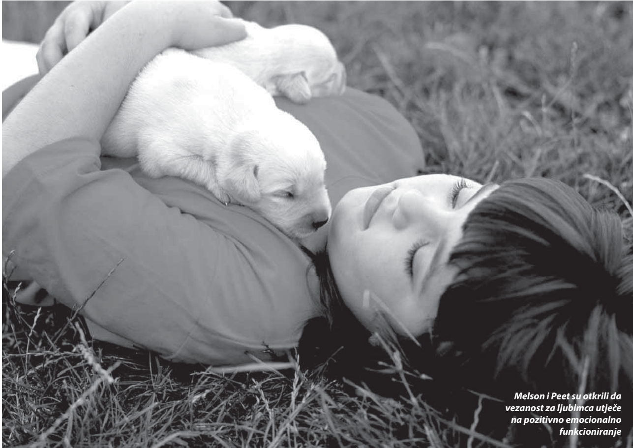
Melson i Peet su otkrili da vezanost za ljubimca utječe na pozitivno emocionalno funkcioniranje

Predškolska djeca obožavaju oponašati roditelje, dijete školske dobi može obaviti samostalno pojedine zadatke, dok tinejdžer može u potpunosti preuzeti na sebe svu odgovornost za ljubimca.