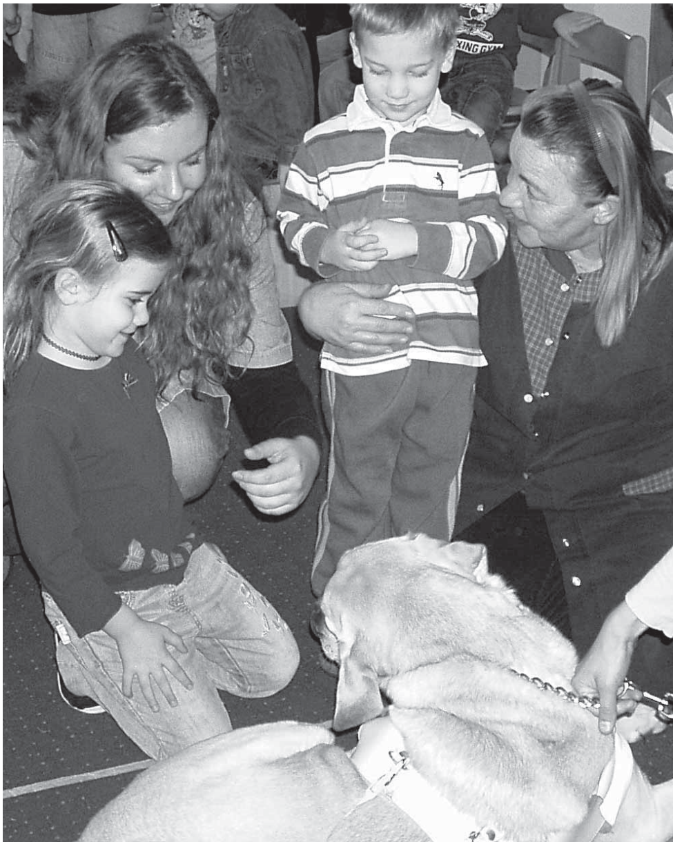
Ustrajna privrženost može biti značajan izvor potencijalne blagodati i užitka koje ljubimci donose djeci

u djece. To dolazi kao rezultat toga što ljubimac funkcionira kao slušač djetetova govora, ali i kao atraktivni verbalni poticaj, izazivajući komunikaciju u djetetu u formi pohvale, naredbi, hrabrenja i uskraćivanja. No ipak nema stvarnih dokaza koji bi podupirali ove hipoteze.