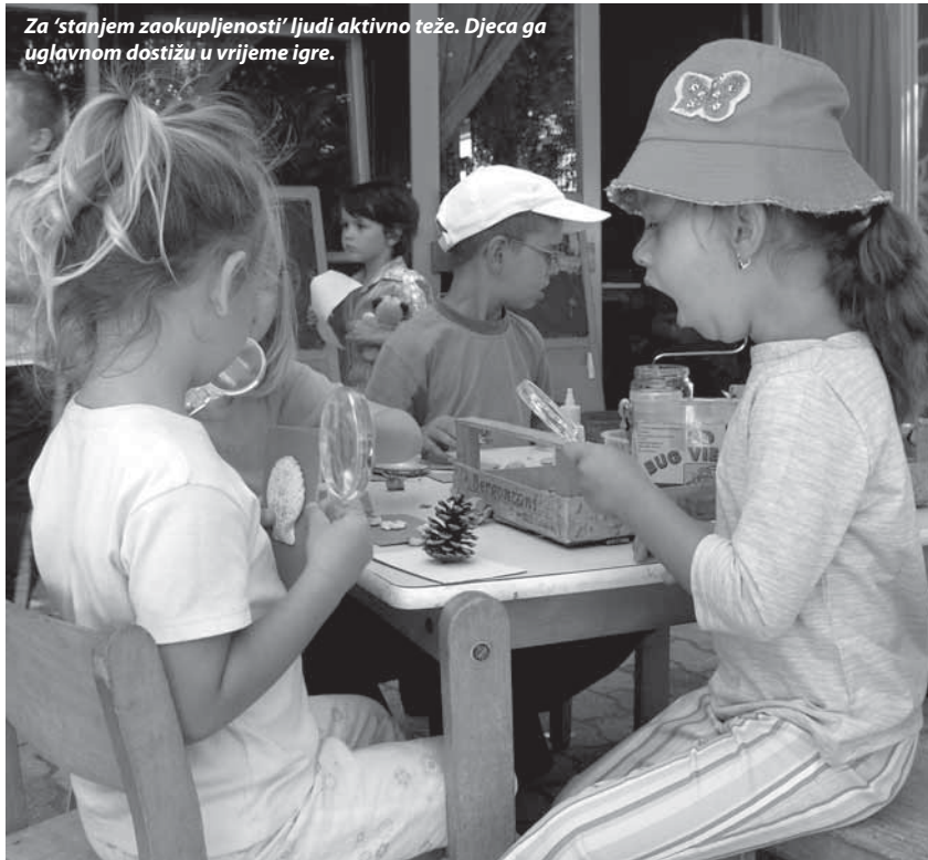
Za 'stanjem zaokupljenosti' ljudi aktivno teže. Djeca ga uglavnom dostižu u vrijeme igre.

nema kalkuliranja o mogućim koristima. Zbog toga se mijenja percepcija vremena (vrijeme vrlo brzo prolazi). Nada-lje, javlja se otvorenost za (odgovarajuće) podražaje, kao i pojačan intenzitet perceptivnih i kognitivnih funkcija koji nije prisutan u aktivnostima druge vrste. Smisao i značenje riječi i pojmova osjeća se puno dublje i snažnije. Daljnja analiza otkriva da uključenost donosi osjećaj zadovoljstva i osjećaj tjelesne prožetosti pozitivnom energijom. Za 'stanjem zaokupljenosti' ljudi aktivno teže. Djeca ga uglavnom dostižu u vrijeme igre.