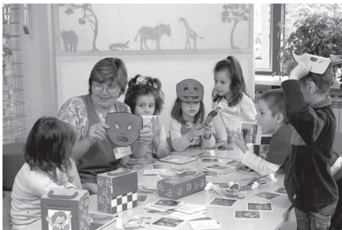
Dijete treba pomoć odraslih kako bi došlo u dodir sa svojim vlastitim osjećajima, osvijestilo svoju potrebu i unutarnje stanje