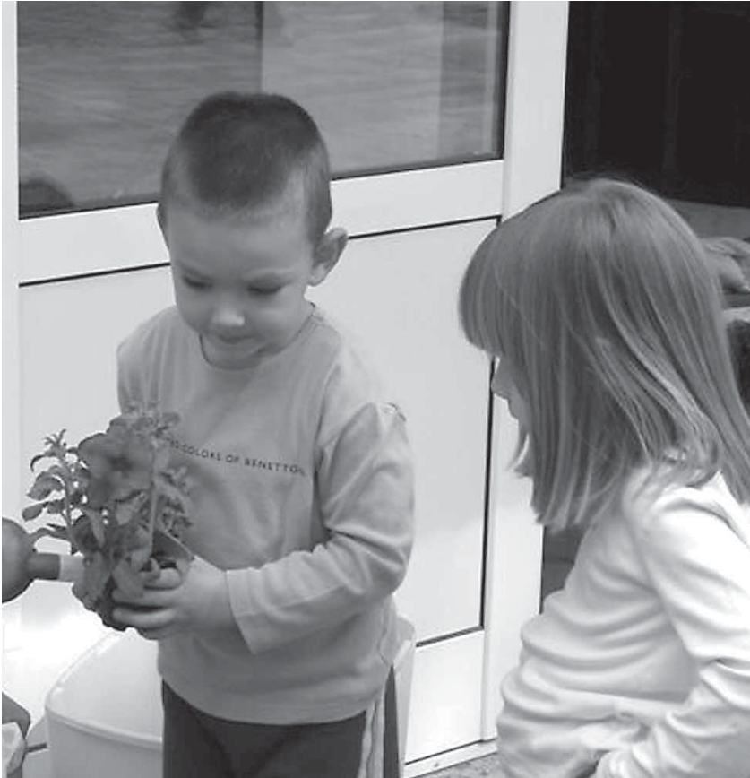
Prijatelji su slični i po onome što Berndt naziva usmjerenošću na dječju kulturu.

vrtića – dva u Zagrebu i jedan u Zaprešiću, a prikupljeni su podaci o spolu i dobi djece, te procijenjene različite karakteristike djece u koju se djeca zaljubljuju ('objekti zaljubljenosti'). Na pitanja Upitnika o dječjim ljubavima usmeno su odgovarala djeca. U obradi rezultata, utvrđene su povezanosti različitih karakteristika, razlike između djece koja jesu ili nisu trenutno zaljubljena, te između manjeg (Zaprešić) i većeg grada (Zagreb). Rezultati su podržali veći dio postavljenih hipoteza.