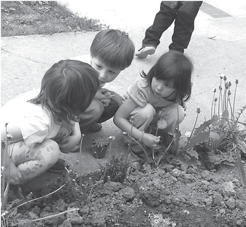
Prijateljstva predškolske djece obično su kratkotrajna, a stabilnost prijateljstava ovisi prvenstveno o stabilnosti zajedničkog boravka u istom okruženju.