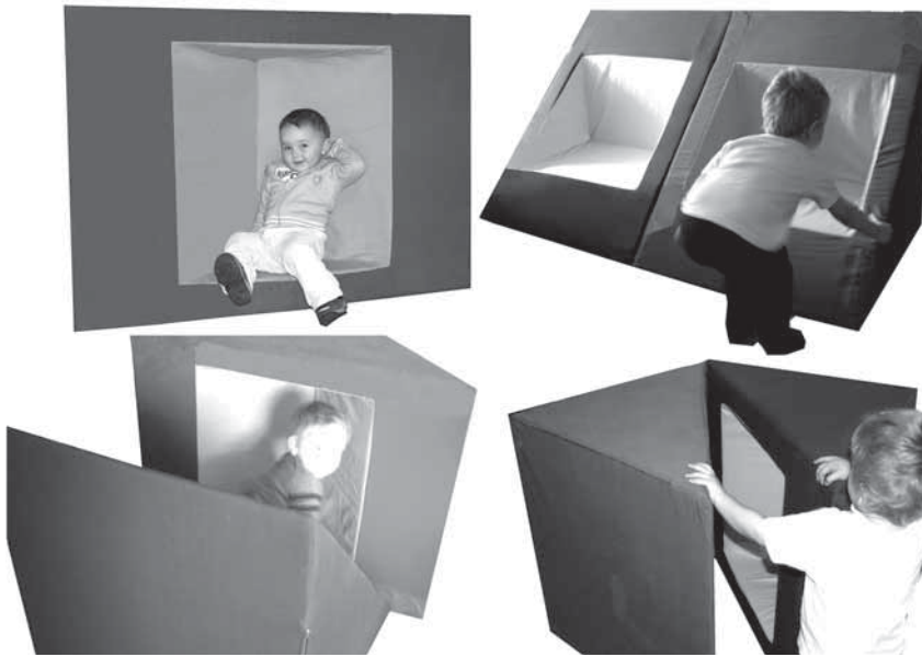
Prototip spužva - namještaja za djecu 'BARETONCI': To su foteljice za svakodnevnu igru ili za osamu. Prepolovljena kocka od spužve razdvaja se u dva elementa - foteljice, a raznim kombinacijama postaje i element za gradnju dječjih skrovišta u unutarnjem prostoru. Projekt ATMOSFERA - 2004. godine