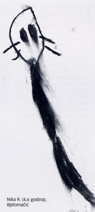
Nika R. (4,6 godina), Bjelomačić

Kroz razgovore djeca uočavaju sve o sebi te činjenicu da vole drukčija jela, igre - da se razlikuju.