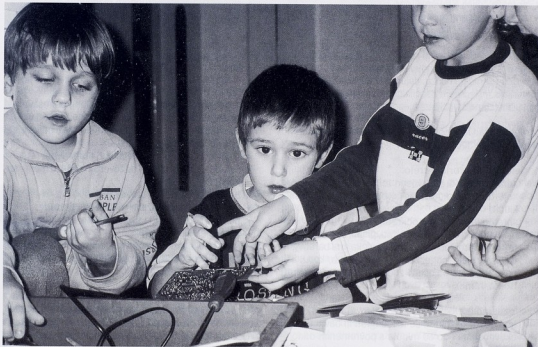
Dječji vrtić Oršula, Šibenik

drukčiji dnevni, tjedni i godišnji ritam života cijele obitelji, ili jednostavno ne žele djetetu "oduzeti" godinu života – neka se još igra! Naravno, ima i onih roditelja koji dijete žele u školu upisati ranije jer misle kako bi se, budući da već čita i piše, sljedeće godine u školi moglo dosadivati. Iстина je da je polazak u školu prva prava prekretnica u životu. Vrtić je "generalna proba" zavrivanja u veliki svijet izvan obitelji, vježbanje samostalnosti i odnosa s vršnjacima, a škola je prvi ozbiljan ispit samostalnosti, odgovornosti i ispunjavanja obveza.