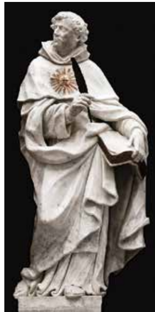
12 Giovanni Comin, Sveti Toma Akvinski , crkva San Pietro Martire, Udine

Giovanni Comin, St Francis of Assisi, Franciscan church in Trsat