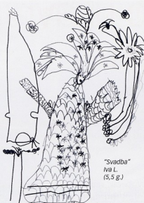
"Svadba" Iva L. (5,5 g.)

Kod djevojčice Ive L. (5,5 godina) primjećeno je visoki stupanj kreativnosti.