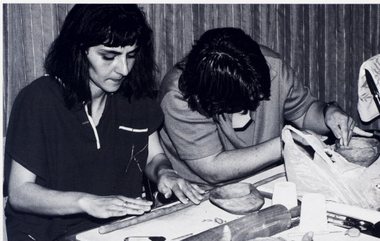
Odgovitelji na tečaju keramike

se tek kad smo odgovitelji uključili u stvaranje plana stručnog usavršavanja. Danas znamo: iznimno su važna znanja koja odgovitelji dobivaju od stručnih suradnika, kao i način na koji ih dobivaju. No, zapravo su odgovitelji ti koji odlučuju o važnosti. Ako im je nešto važno, ako temu nalaze korisnom za sebe, češće će se i bolje uključivati u učenje i učiniti ono što se od njih očekuje. Kad je odabrana tema izbor odgovitelja, znači da je za svoj izbor i odgovoran.