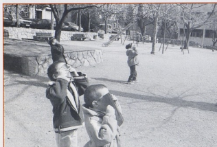
Što je u igrački?, DV Krijesnica, Rijeka

izvor informacija o tome što djeca mogu ili ne mogu, je li to rezultat neiskustva, vještine ili nevještine. One daju odgovor je li odgajatelj podcijenio sposobnosti djeteta nudeći mu poticaje koji ne bude interes jer su njihovi sadržaji prejednostavni, prečesti ili konstantni. Na kraju smo sudionicima radionice podijelili anketu Procjena uspješnosti realizacije pedagoške radionice i dobiti za sudionike. Rezultat treće radionice je osviještenost osobnih kompetencija odgajatelja u kreiranju i ostvarivanju odgojnog rada s djecom te uočavanje važnosti i potrebe za stalnim stručnim usavršavanjem i istraživanjem u svom radu.