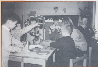
Centar za istraživanje, DV Žabica iz Otoka

Najprije treba podijeliti članove radionice u manje grupe. Svi sudionici trebaju razmijeniti svoja osobna iskustva o igrama koje su igrali u djetinjstvu odgovarajući na pitanja: Što su se igrali? S kim su se igrali? Čime su se igrali? Vježba se odigrava onoliko dugo koliko je sudionicima potrebno. Svatko govori o osobnim iskustvima koliko želi, ostali slušaju. Voditelj radionice ispisuje na plakat vrste igara i sredstava, klasificiranih prema vrstama aktivnosti koje se mogu kategorizirati u odnosu na životno-praktične i radne, raznovrsne igre, raznovrsno izražavanje i stvaranje, istraživačko-spoznajne, umjetničke aktivnosti, aktivnosti koje uključuju kretanje te društvene i zabavne teme. Nakon toga na red dolazi zajednička diskusija o svim temama koje su provedene u vježbi. Na kraju diskusije sudionici su zaključili da provedene igre predstavljaju najpoželjnije vrste aktivnosti za realizaciju u grupama. To su igre koje pamtim i volimo pa će ih i djeca s kojom radimo u vrtiću pamtili i voljeti. Rezultat prve pedagoške radionice su iskustvom stečene najpoželjnije vrste igara i aktivnosti za provedbu u grupi; raznovrsne igre i istraživačko-spoznajne aktivnosti s prirodnim materijalima iz okoline.