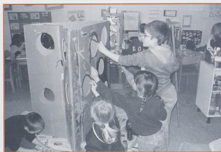
Likovni centar, DV Krijesnica, Rijeka