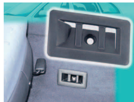
SLIKA 14. Odzračnik podnoga grijala načinjen od PP/PS mješavine

Među prvim proizvodima koji su masovno proizvedeni od Elana 515 , odzračnik je podnoga grijala za razne modele volkswagena i audija (slika 14).