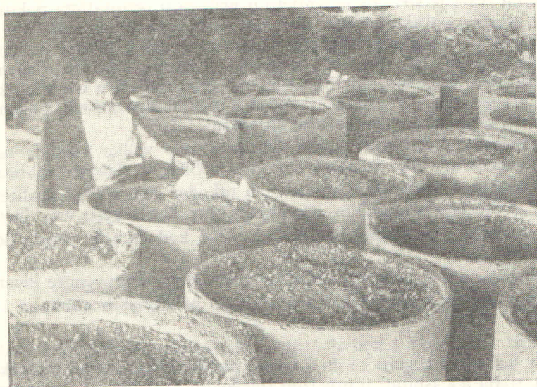
Slika 1 — Pokus siliranja lucerne u plastičnim vrećama i betonskim cijevima

Ova metoda siliranja bazira na dodavanju manjkajuće količine šećera u obliku melase, kako bi se stimulirao rad bakterija mliječno-kiselog vrenja i stvorila veća koncentracija mliječne kiseline. U Jugoslaviji ova metoda siliranja malo je zastupljena, dok u nekim zemljama s razvijenom industrijom šećera predstavlja glavni način siliranja.