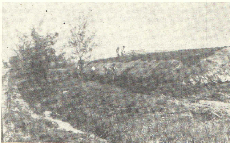
Slika 2 — Nadzemni trap-silos paraboličnog oblika, pokriven polietilenskim pokrivačem

U svijetu postoji priličan broj eksperimentalnih rezultata s različitim vrstama silosa. Po općoj ocjeni najbolji se rezultati postižu u silo-tornjevima, nešto slabiji u trenč-silosima, a najslabiji u nadzemnim trap-silosima s ne-