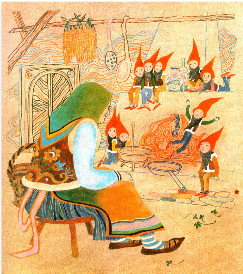
Irena Tarasová. Full page illustration for the story “Striborova hora” [Stribor’s Forest]. Ivana Brličová-Mažuranićová: Rozprávky z pradávna (1976: 73). Irena Tarasová. Ilustracija za priču „Striborova hora“ [Šuma Striborova]. Ivana Brličová-Mažuranićová: Rozprávky z pradávna (1976: 73).