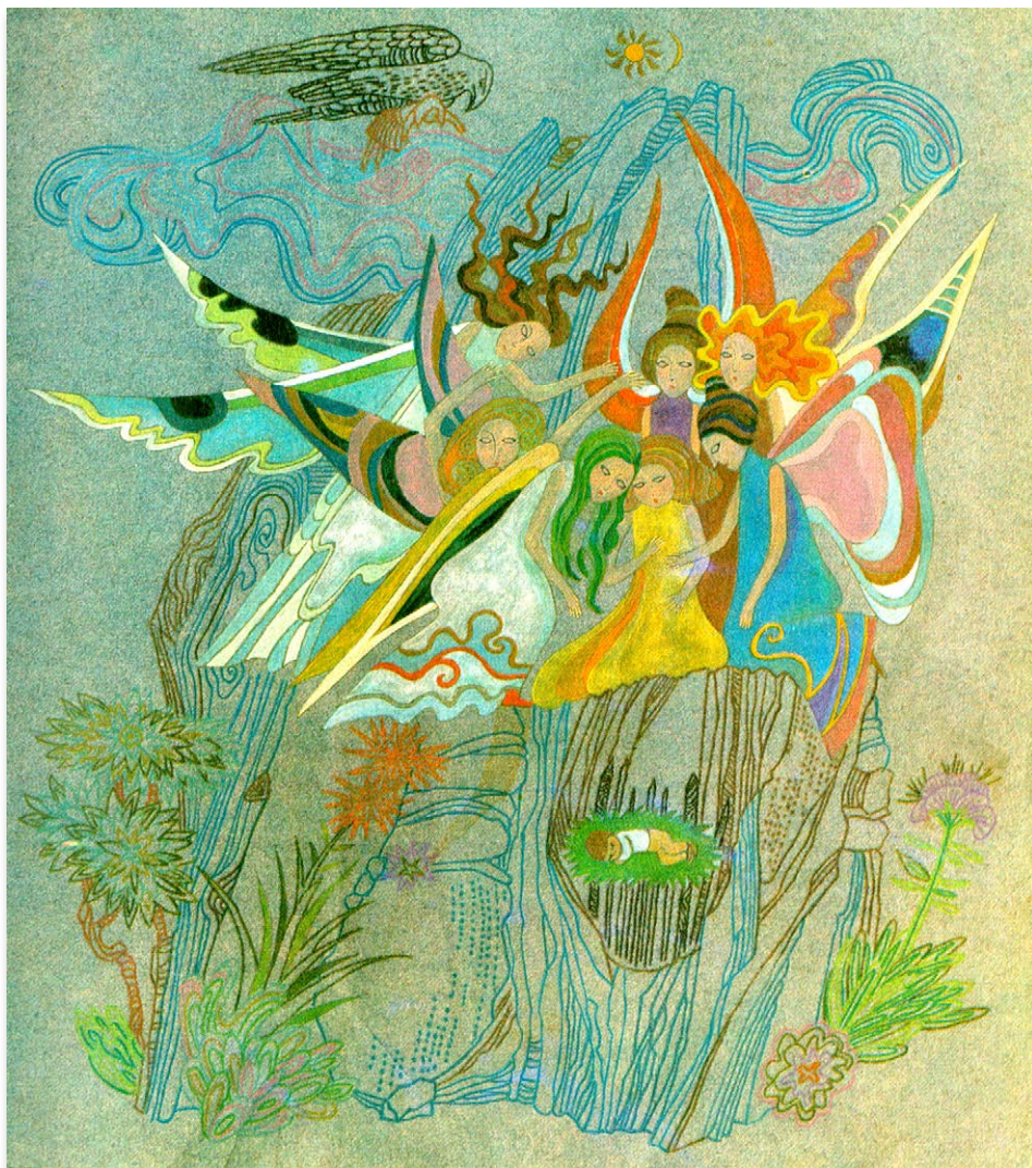
Irena Tarasová. Full page illustration for the story “Braček Jelenček a sestrička Ruženka” [Little Brother Primrose and Sister Lavender]. Ivana Brličová-Mažuranićová: Rozprávky z pradávna (1976: 91).

Irena Tarasová. Ilustracija za priču „Braček Jelenček a sestrička Ruženka“ [Bratac Jaglenac i sestrice Rutvica]. Ivana Brličová-Mažuranićová: Rozprávky z pradávna (1976: 91).