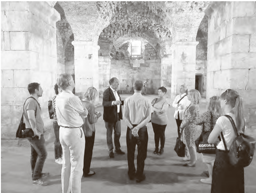
← Obilazak Dioklecijanove palače

Za sve istraživače od velike je važnosti bila prezentacija izvora za istraživanje povijesnih urbanih krajolika