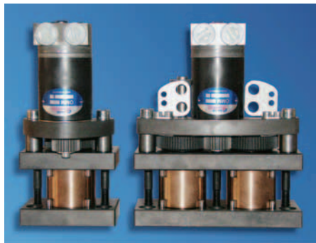
SLIKA 25. Uređaj za odvrtanje navojnih jezgara tvrtke EXAflow

đaji se isporučuju sklopljeni i s jamstvom od nekoliko stotina tisuća ciklusa (ovisno o izvedbi uređaja).